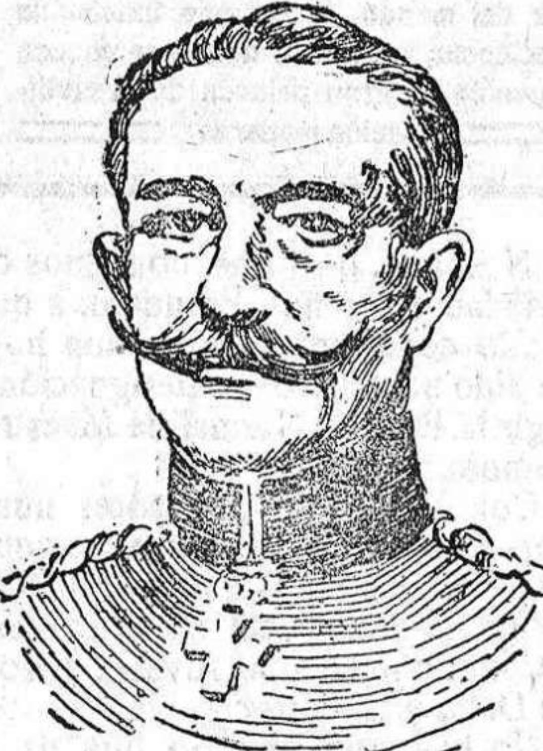
Von Bissing, gobernador alemán de Bruselas.

Véase el anuncio con los nuevos precios de Carbones de «LA ASTURIANA»