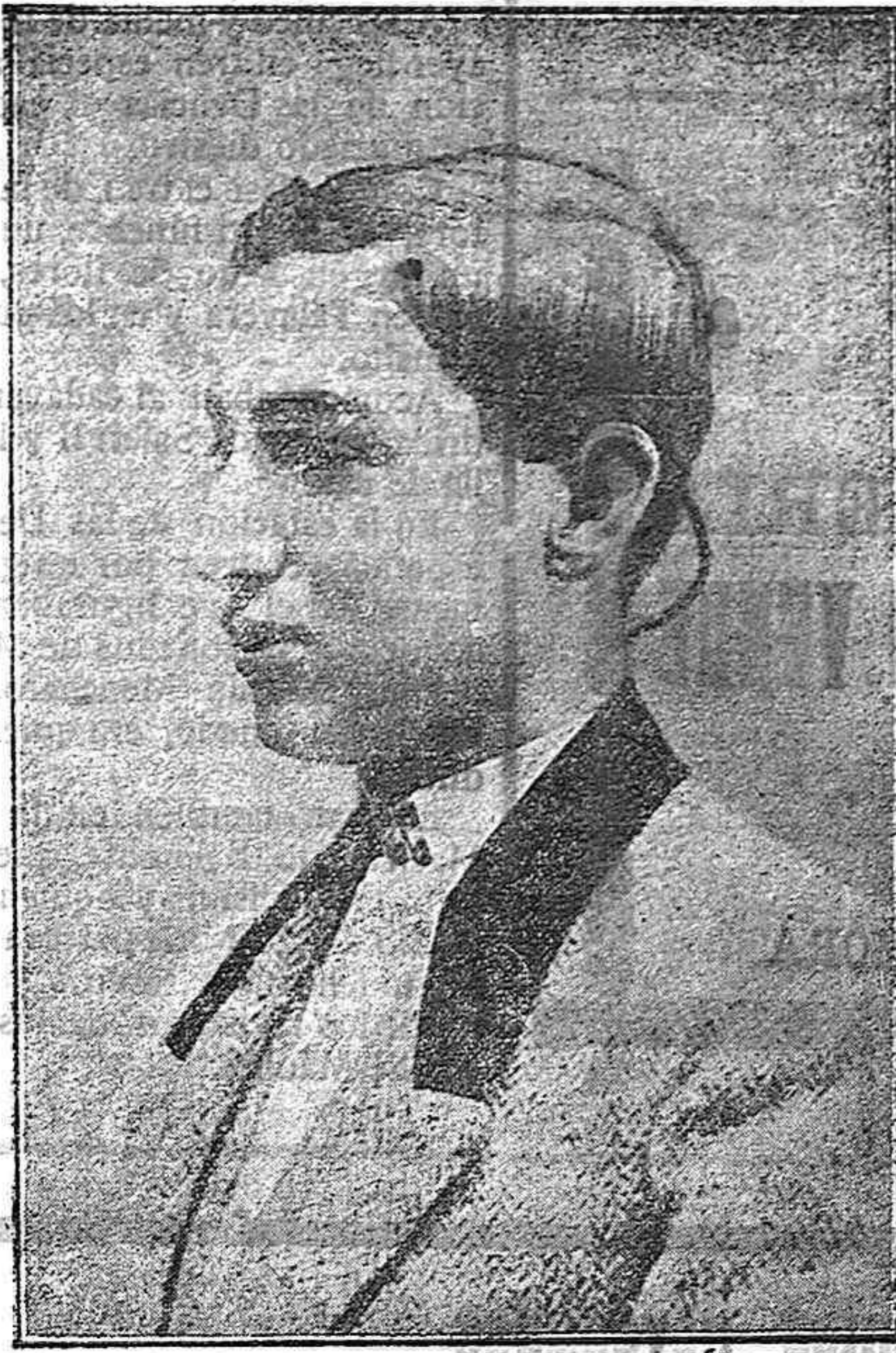
JOSE GOMEZ ORTEGA "JOSELITO"

Su hermano político Sánchez Mejías, al llegar a Madrid ha hecho a