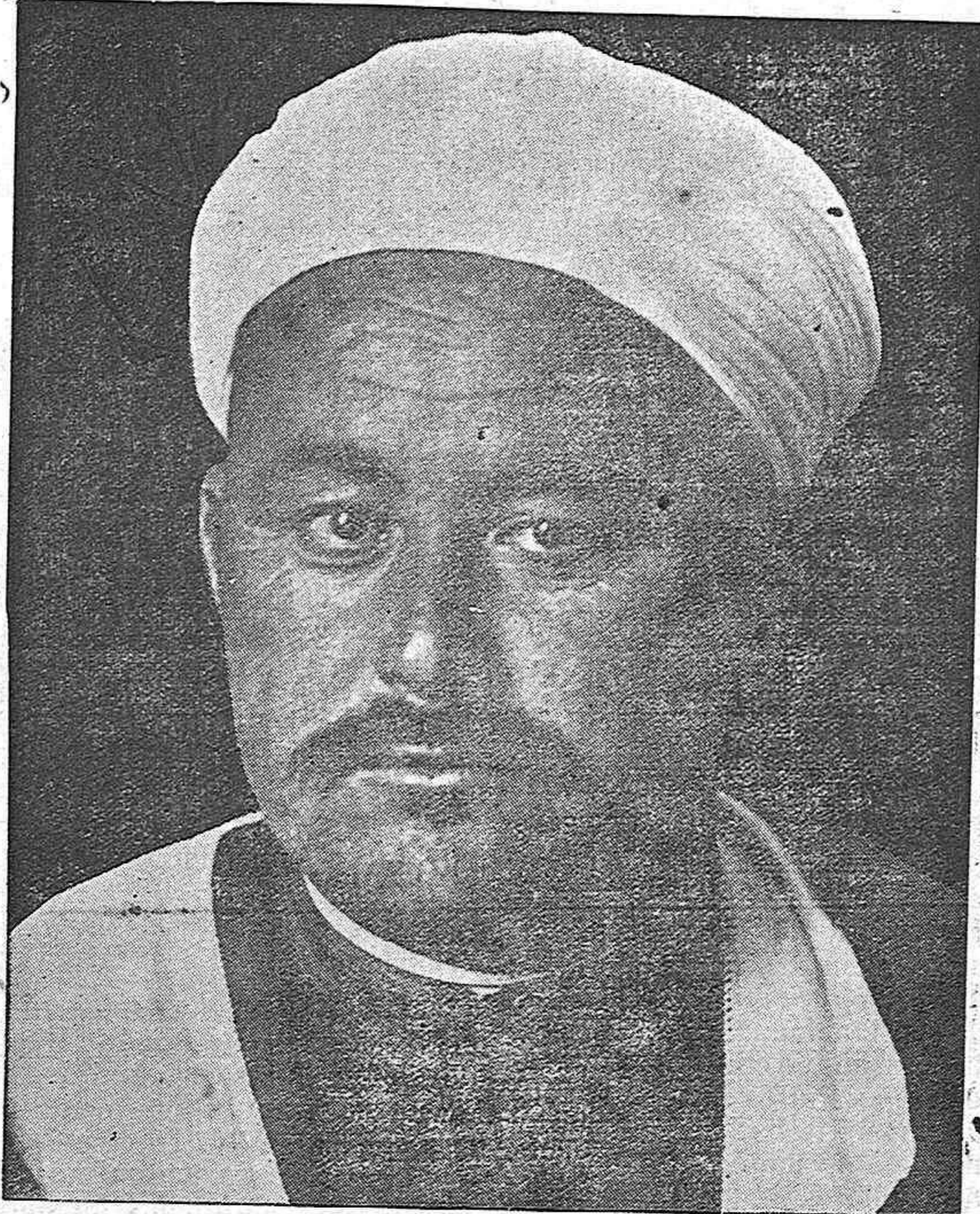
Abd-el-Krim, el miserable bandido, asesino de tantos españoles que, dando una prueba más de su cobardía ha pedido clemencia a Francia, para salir con vida del derrumbamiento marroquí

Se ha publicado una R. O. disponiendo que se levante la prohibición de exportar cereales y sus harinas, establecida en la Real orden de 3 de Agosto de 1924 y confirmada por otra de 12 de Julio de 1921, quedando derogada la parte correspondiente de las citadas disposiciones en cuanto a cereales y sus harinas se refiere.