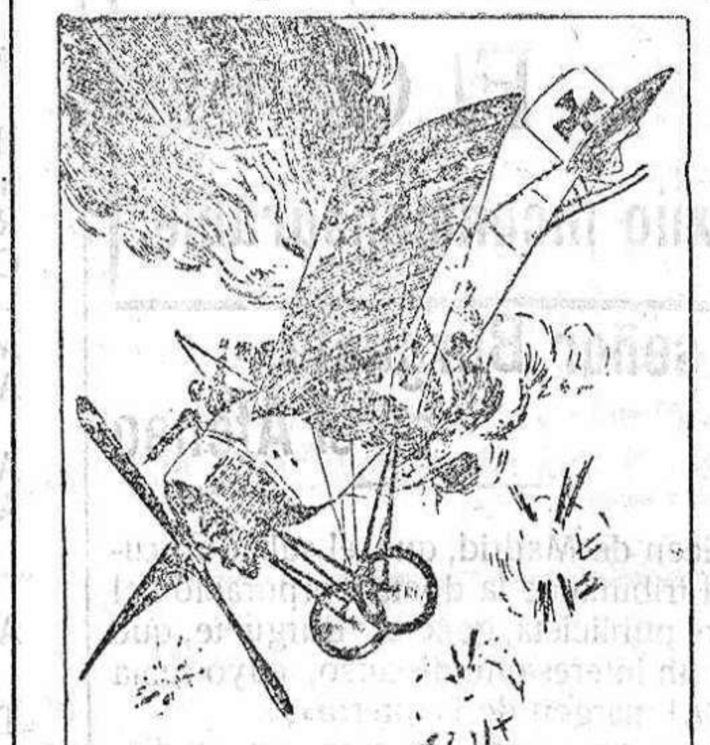
Incendio de un monoplano alemán en el frente de Verdúm.