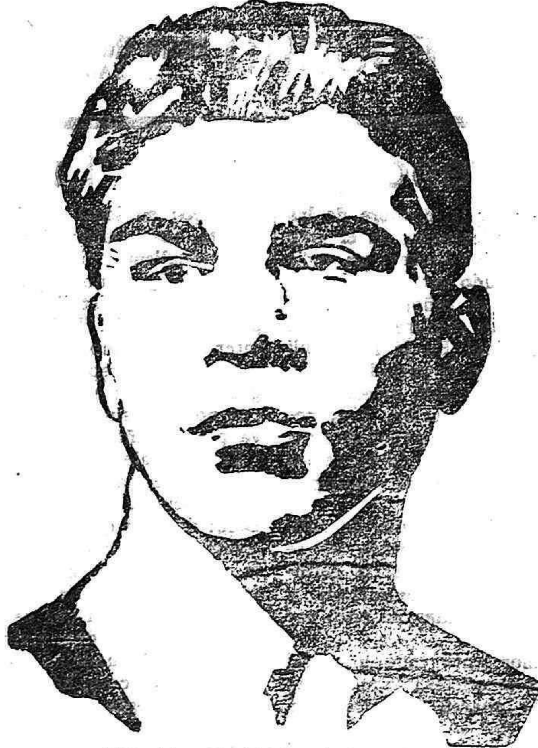
El teutón, MAX SCHEMELLING, ex campeón del mundo de todas las categorías, que próximamente luchará con el grioso español, Paulino Uzcudun,