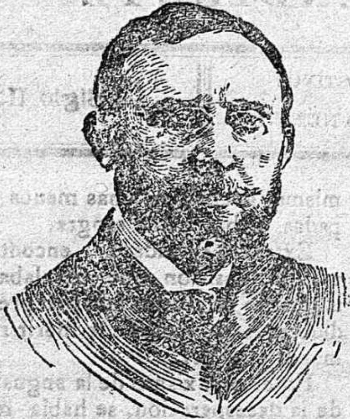
Señor Marqués de Figueroa, ministro de Gracia y Justicia.

El marqués de Figueroa, como ministro de Gracia y Justicia, obsecutando sobre su pecho el gran collar de la Justicia, ocupó la silla presidencial, en medio de los magistrados del Supremo.