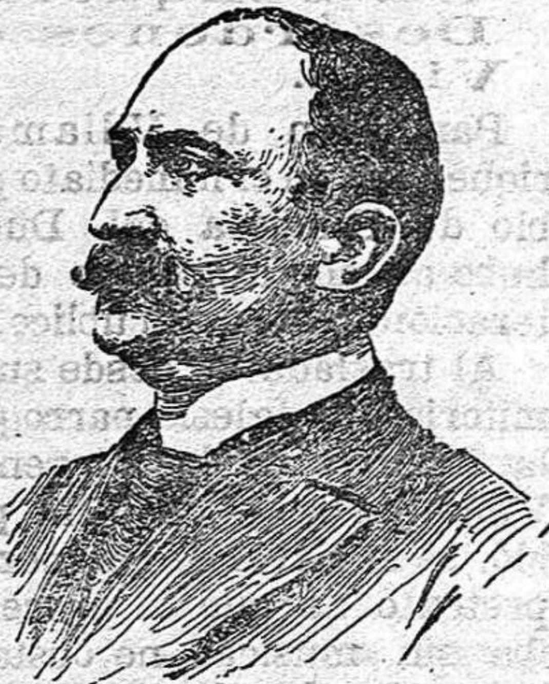
Don Javier Ugarte y Pagés, Fiscal del Supremo.

El ministro leerá un discurso, lleno de sabia doctrina y escrito con tanta corrección, como galanura, desarrollando un tema acerca de las relaciones que existen entre la Moral ó los principios de la Etica, con el Derecho.