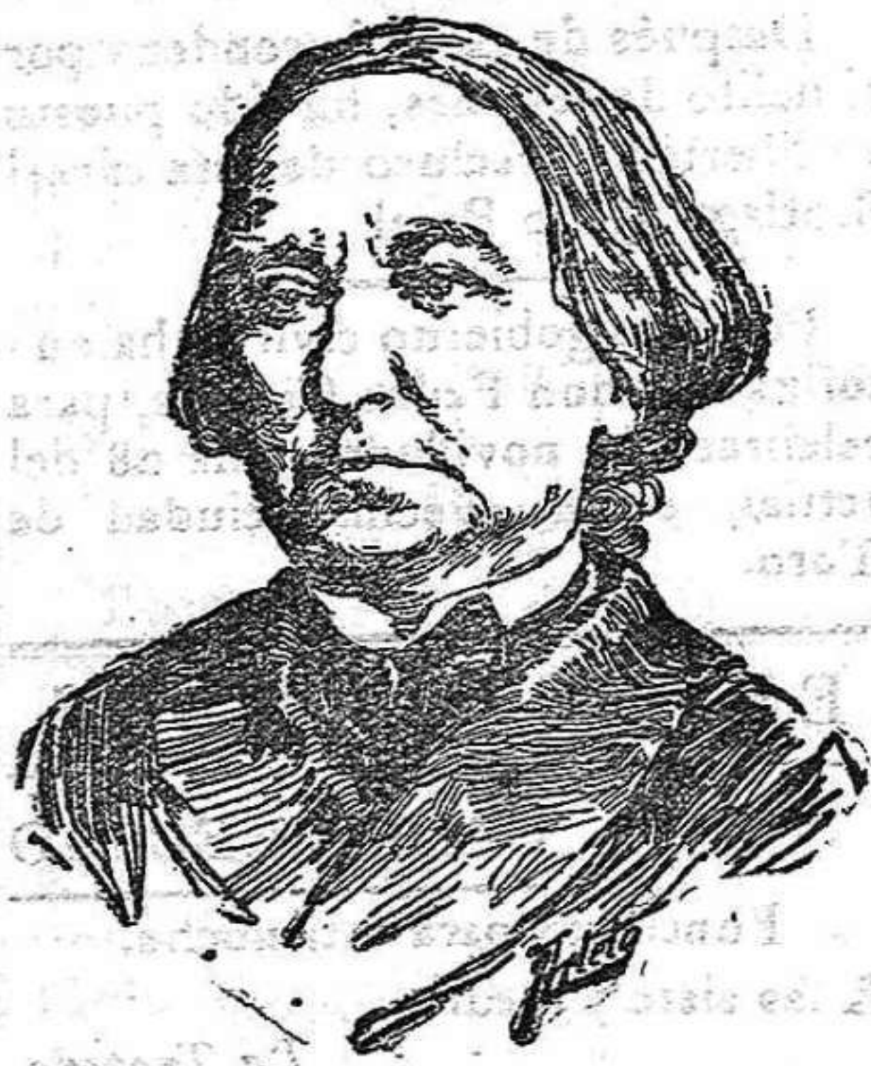
D.ª Concepción Arenal,

Lo dicho debe bastar á los impacientes para que adviertan que HERALDO DE ZAMORA no ha de dejar pasar inadvertido asunto de tanta trascendencia.