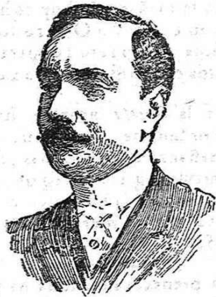
D. LUIS DRAGO

Y después de tratarse otros asuntos de escaso interés, se levantó la sesión.