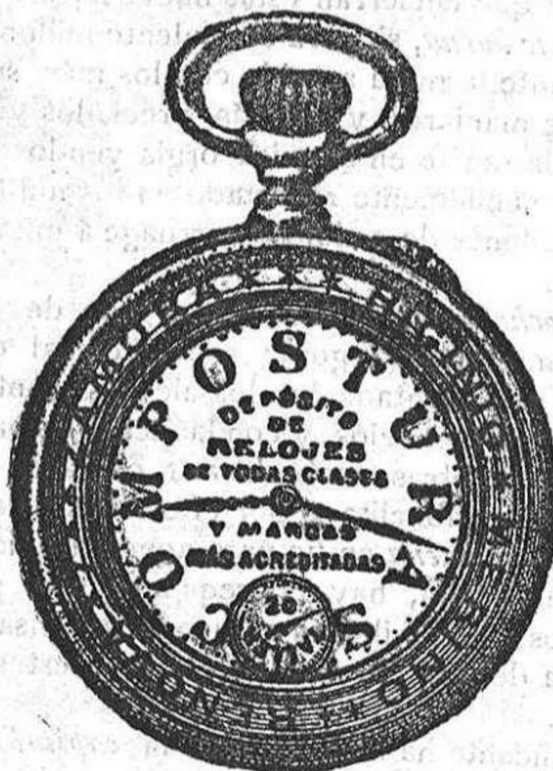
Relojes Mored, péndulos y Reguladores