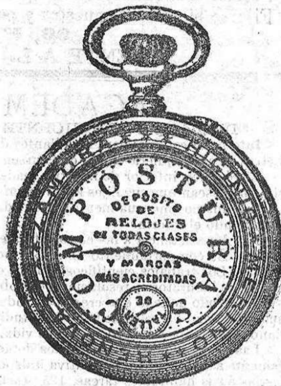
Relojes Mored, pendulos y Reguladores.