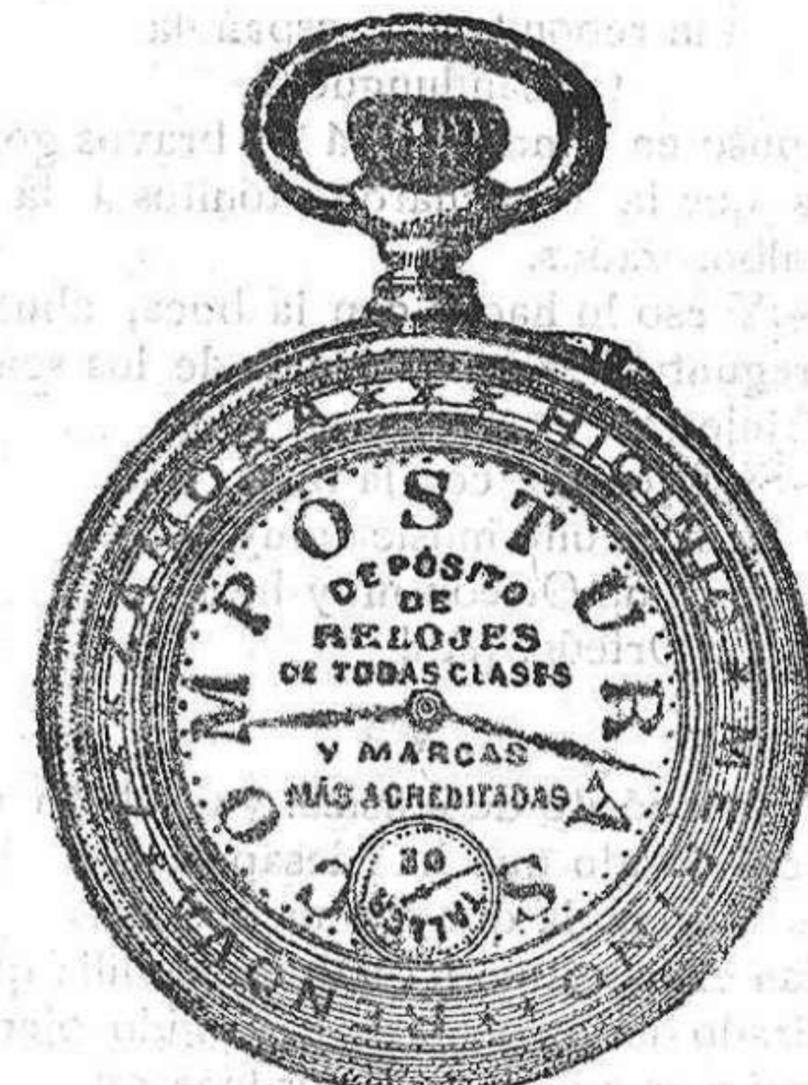
Relojes Mored, péndulos y Reguladores.