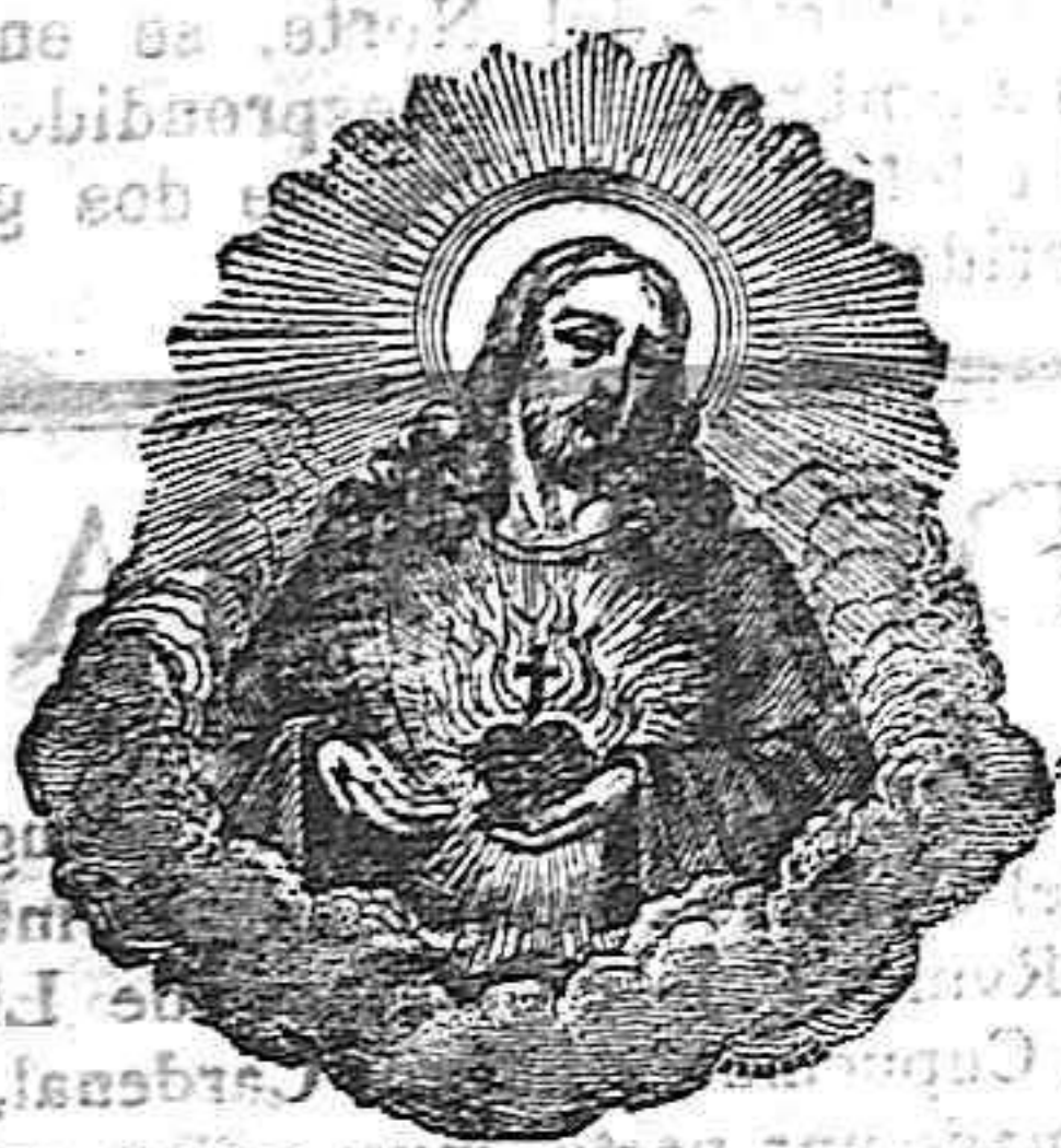
EL SAGRADO CORAZÓN DE JESÚS ALTAR DEL TIMIAMA

Cada mes se celebrarán SEIS misas á intención de los suscriptores á EL ÁNCORA