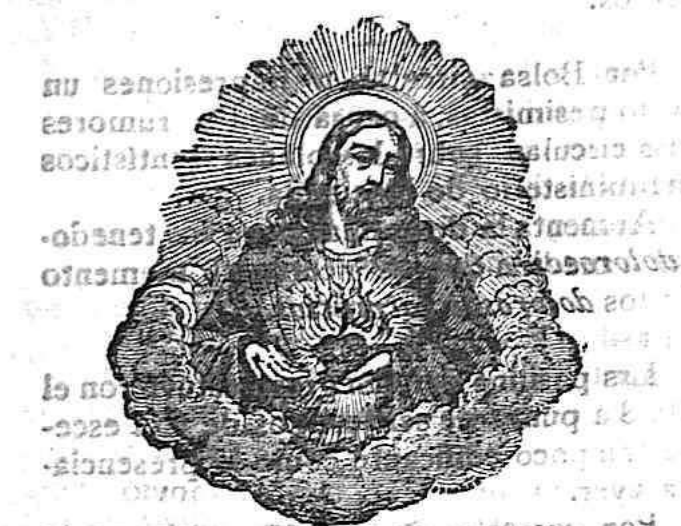
EL SACRADO CORAZÓN DE JESÚS ARCA DEL TESTAMENTO

SUSCRIPCIONES PALMA—Un mes... 1.25 pías. FUERA—Tres meses... 3.75 Número del día, 5 cént.—Atrasado, 10 cént. PAGO ADELANTADO