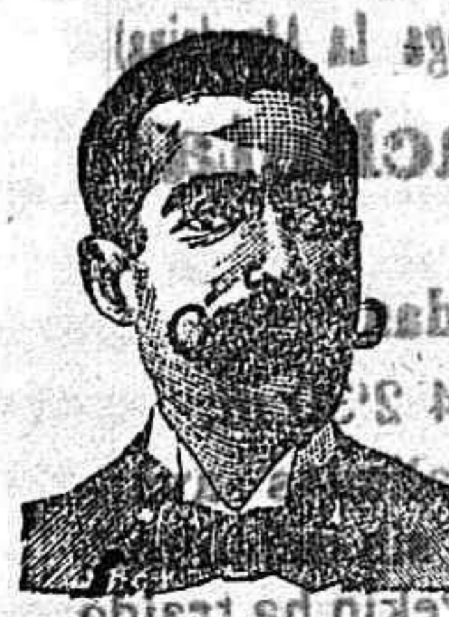
A. SALVATI COSTANZI Calle Diputación, 1417 BARCELONA