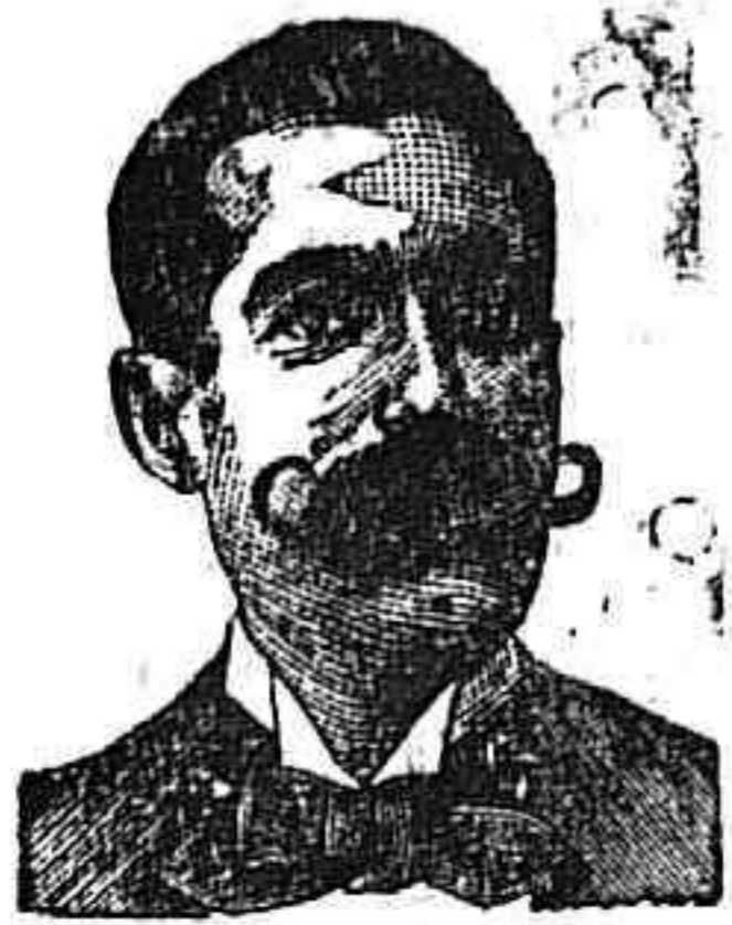
A. SALVATI COSTANZI Calle Diputación, 435 BARCELONA