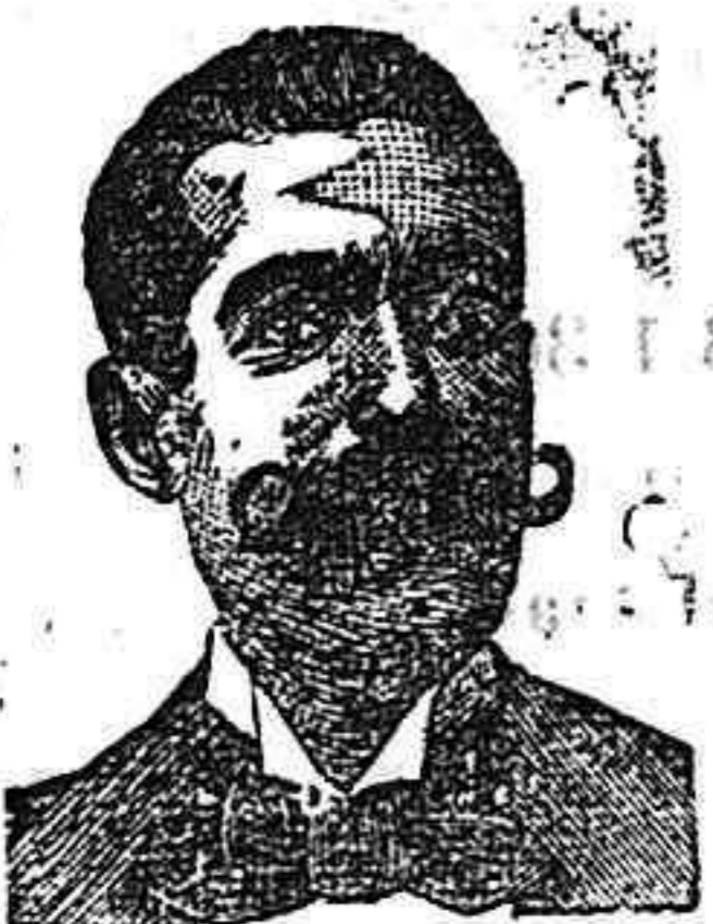
A. SALVATI COSTANZI Calle Diputación, 435 BARCELONA

Aprobado y recomendado por la M. I. Academia Médico-Farmacéutica de Barcelona. El ELIXIR INGLUVINA GIOL, cura la Dispepsia, Gastralgia, Dolores de estómago, Flatos, Disenteria, Malas digestiones, Inapetencia, Vómitos, Estreñimiento, Vientos abdominales, Catarros del estómago, Diarrea, Bilis, Convalecencias difíciles, Vómitos de las embarazadas, y todas las enfermedades del estómago e Intestinos. Las notabilidades médicas prefieren el ELIXIR GIOL á cualquier otro preparado. Venta al por mayor y menor: Farmacia Giol, Paseo de Gracia, 24. Barcelona.