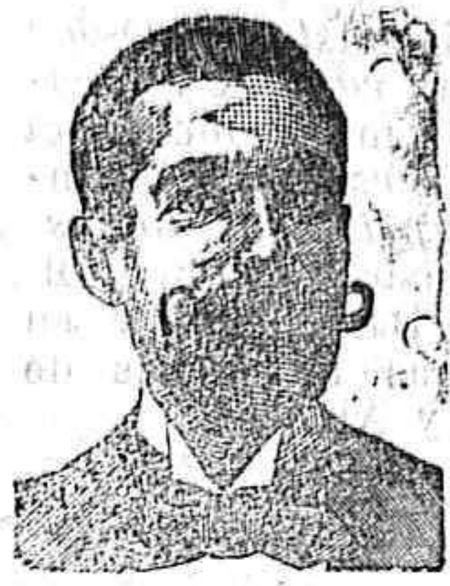
A. SALVATI COSTANZI Calle Diputación, 435 BARCELONA