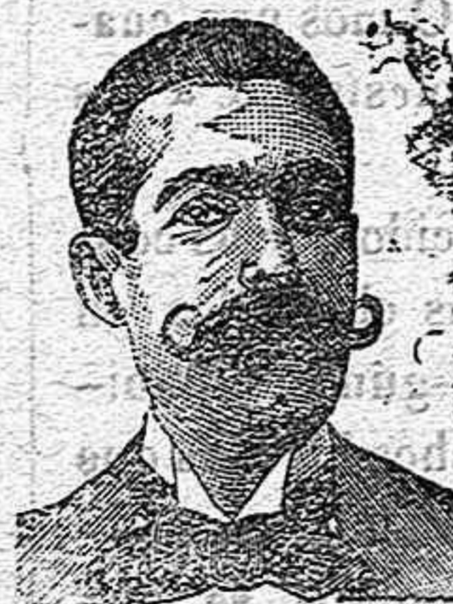
A. SALVATI COSTANZI Calle Diputación, 435 BARCELONA

Puerto Rico, 1. a duros 125 - 2. a duros 85 - 3. a duros 50. Habana, 1. a duros 130 - 2. a duros 90 - 3. a duros 55. Veracruz, 1. a duros 165 - 2. a duros 115 - 3. a duros 50. Para más informes, señores Martínez y Planas, San Juan 20, representantes de la Compañía.