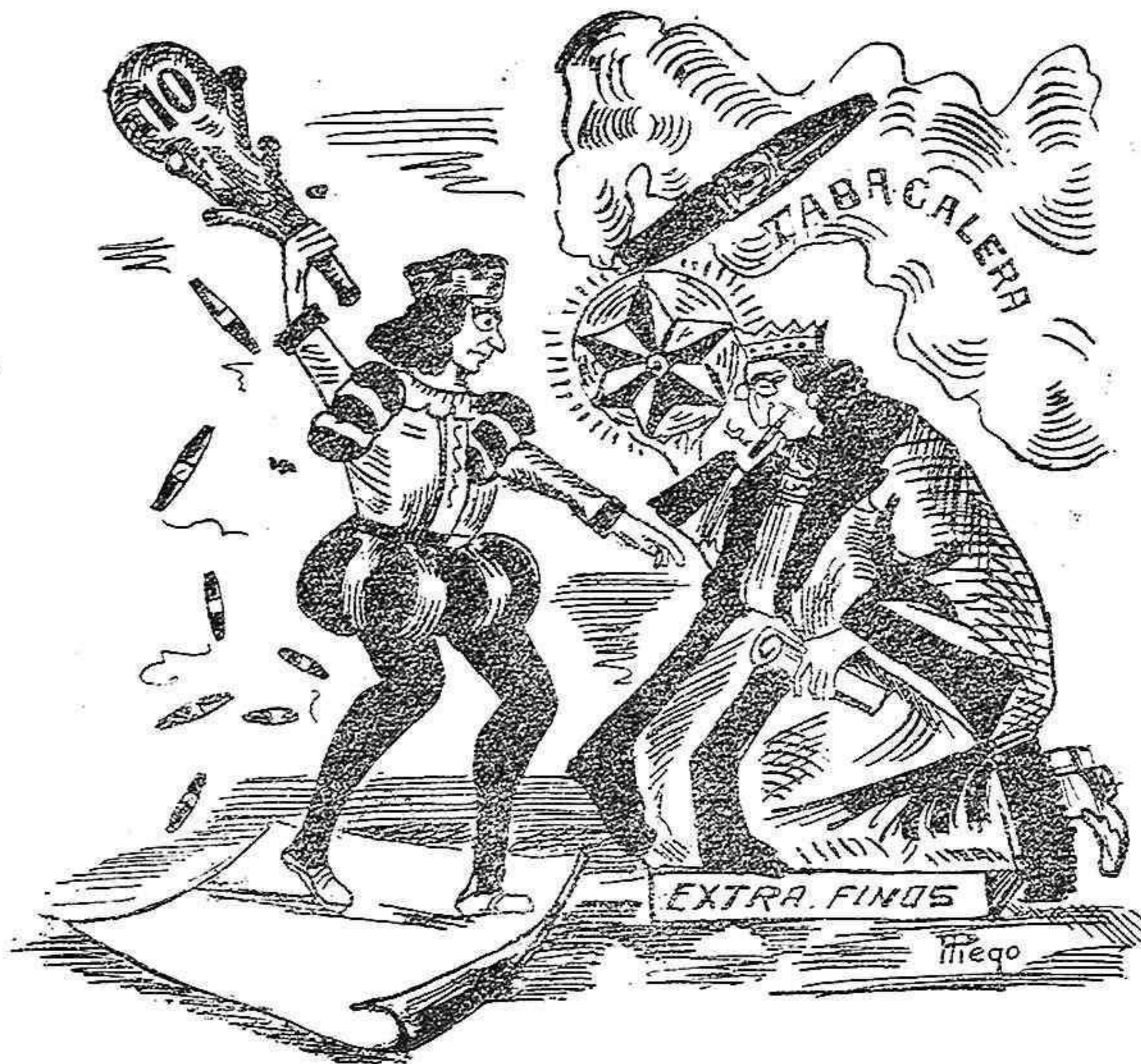
El Rey d'Oros

—Son una guarda de pillos que hem pósen amb grans aparos que m'escápsen molts de duros y lloscas o xigarrillos sa tornarán es meus puros.