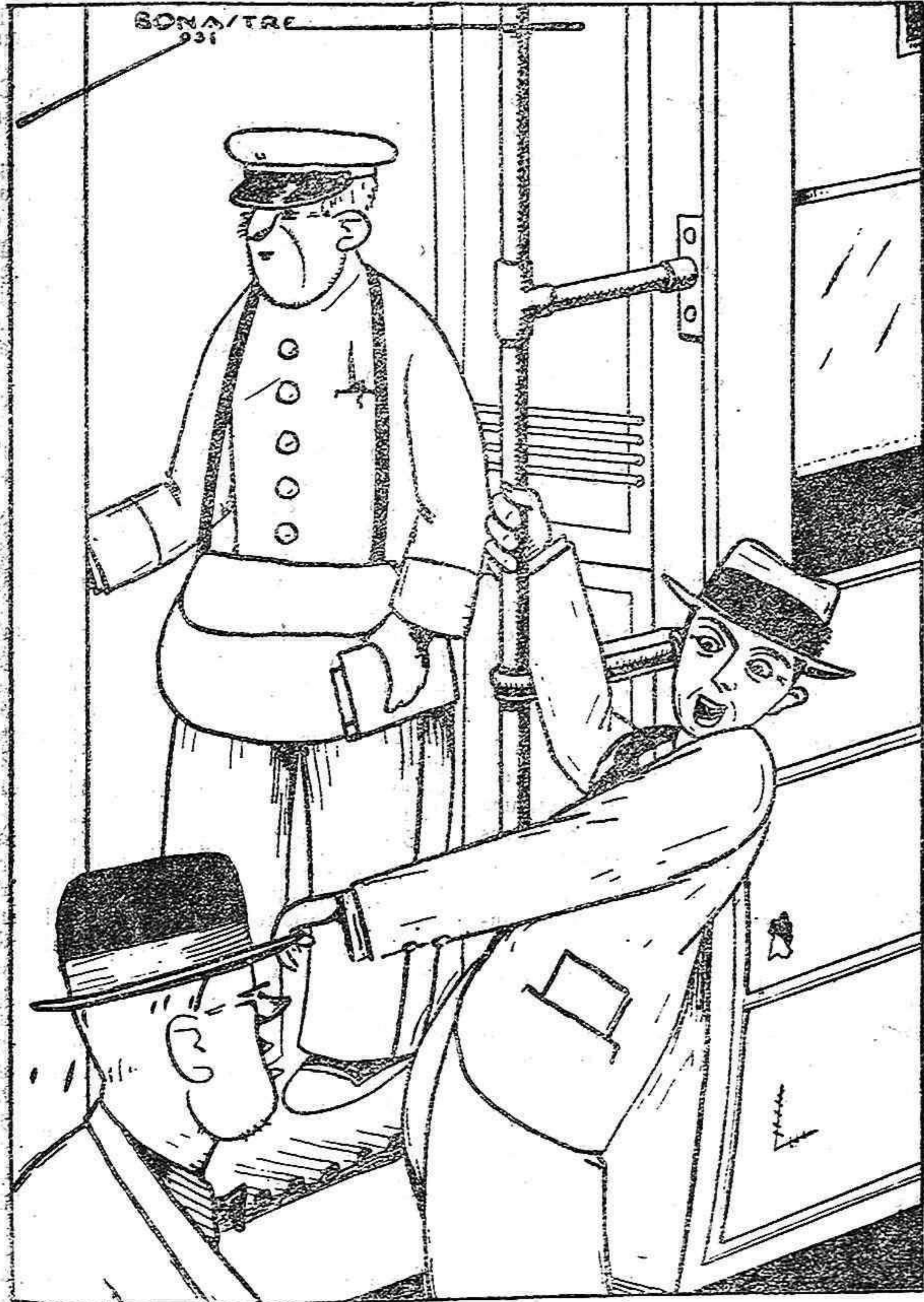
—Avuy frís Juan. —Si frisas, ta convé mes aná a peu.