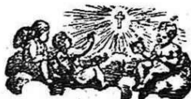
Santo de mañana.