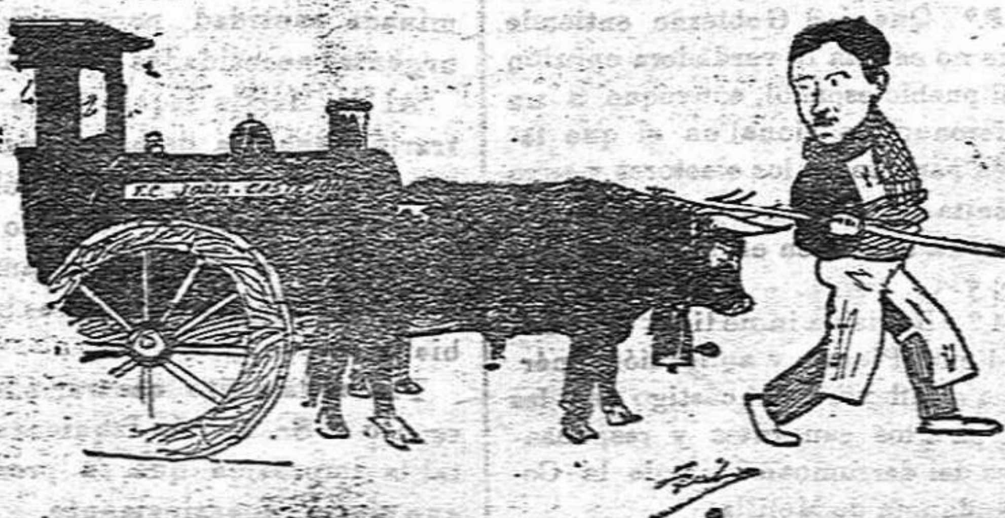
Las gestiones para la construcción del ferrocarril Soria-Castejón van por buen camino.