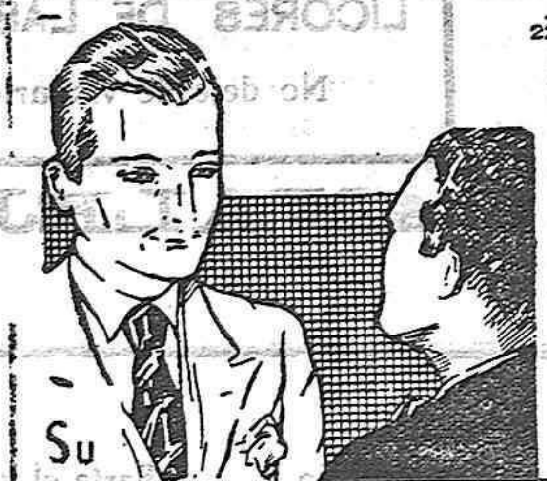
Su ardor de estómago puede terminar en úlcera. Consiga su curación con el