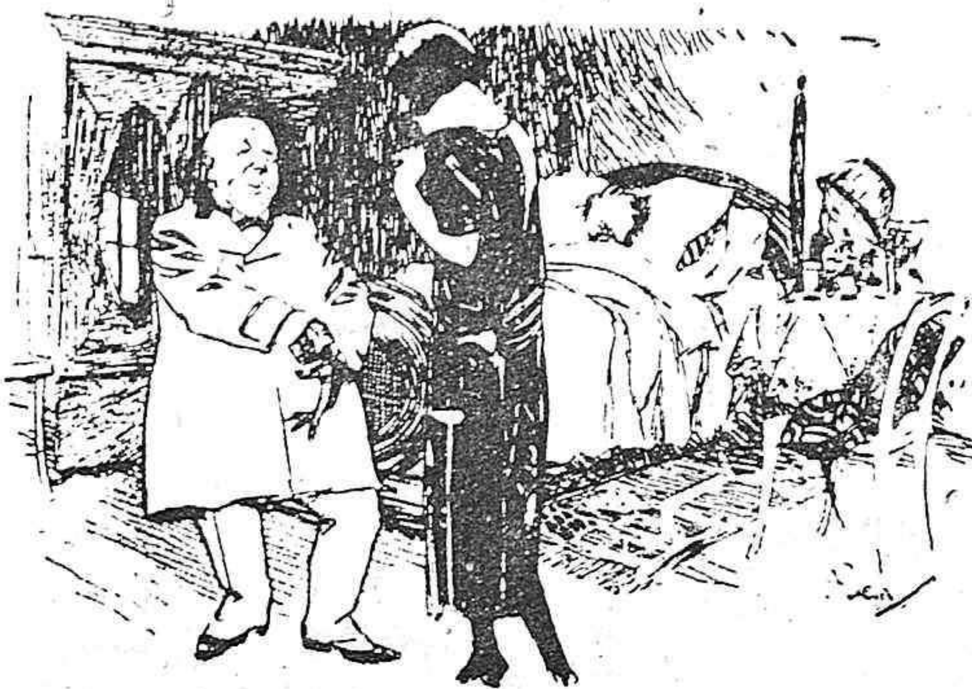
La futura heredera.—Y bien, doctor, ¿hay esperanza? El Médico.—(conocedor del corazón humano). Según lo que usted espere señora.