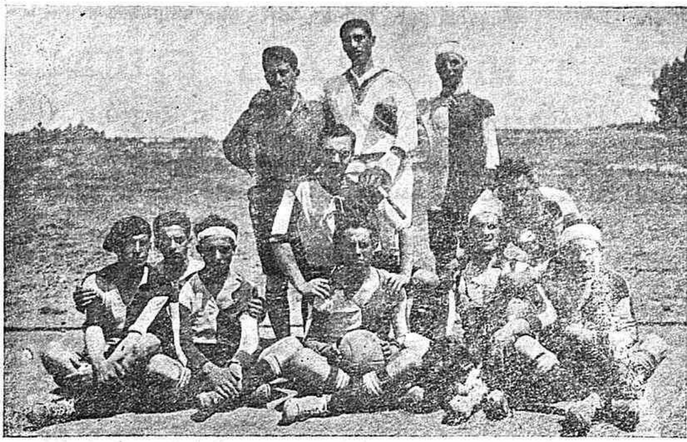
Los jugadores del equipo del «Agreda F. C.» que tan admirablemente han jugado contra el equipo «Turiaso F. C.» de Tarazona un partido de fútbol.