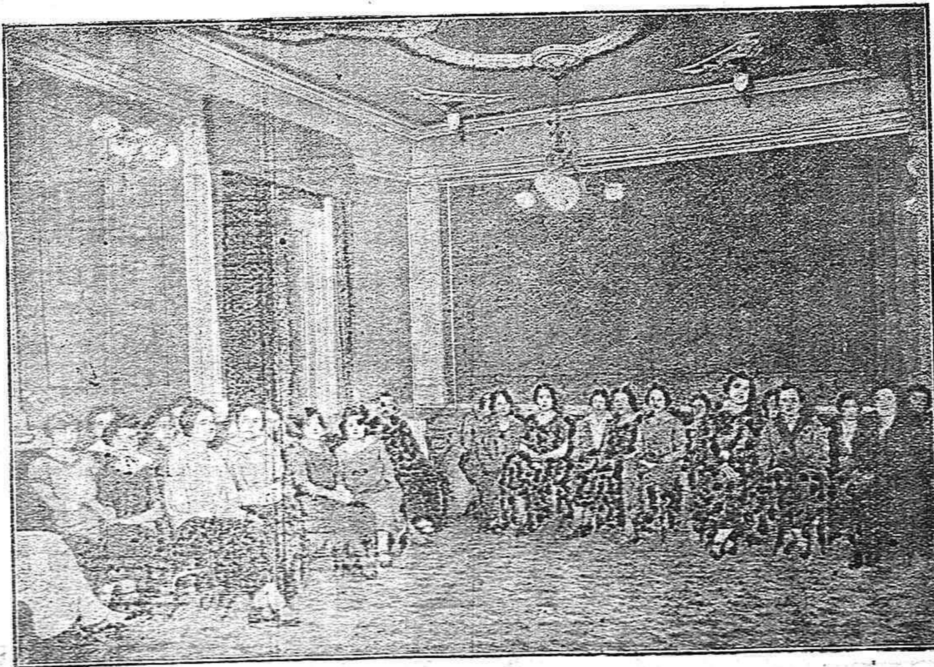
Un rincón del salón de fiestas del Casino de Numancia en noche de baile