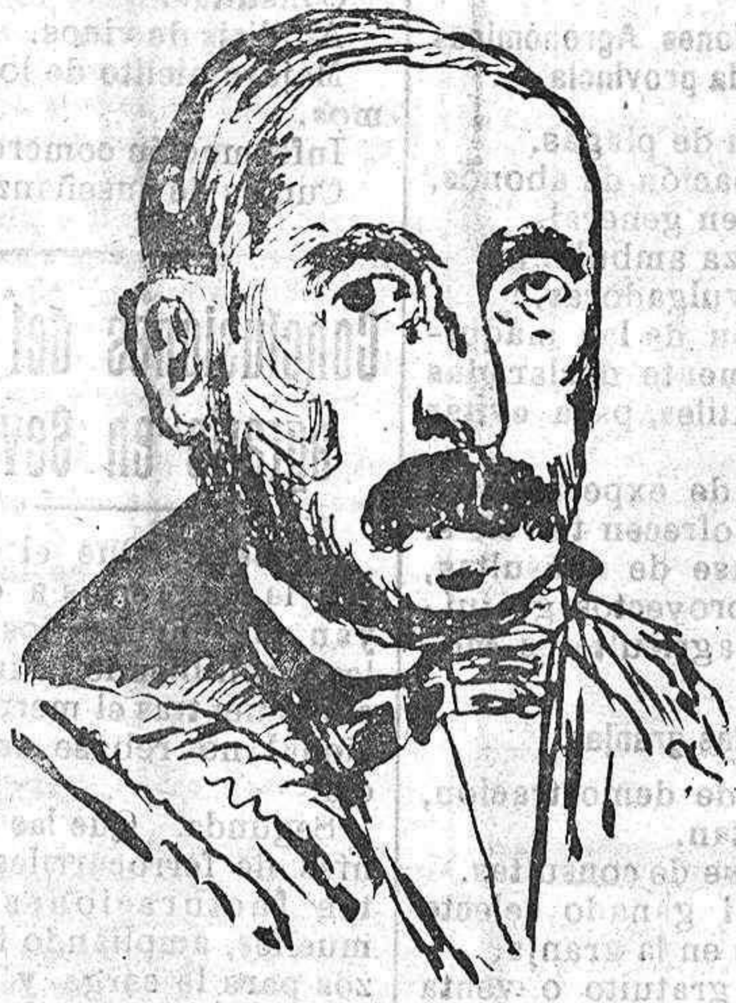
D. Julián Sanz del Río.