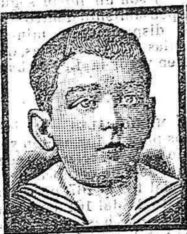
Madrid, Calle del Poz 6, 26 Febrero 1908.