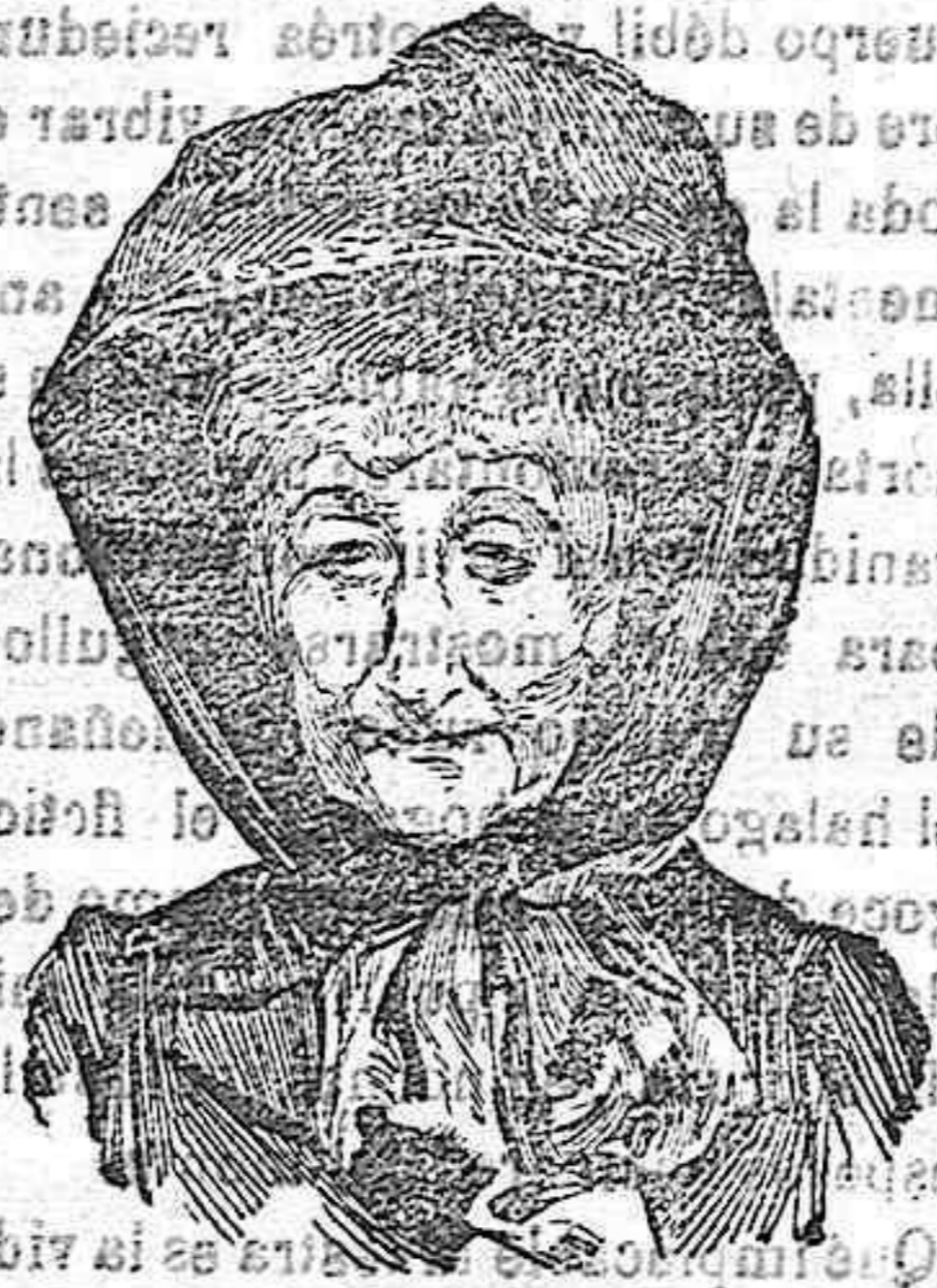
La ex-emperatriz Eugenia que ha llegado a París para someterse a una operación a la vista.