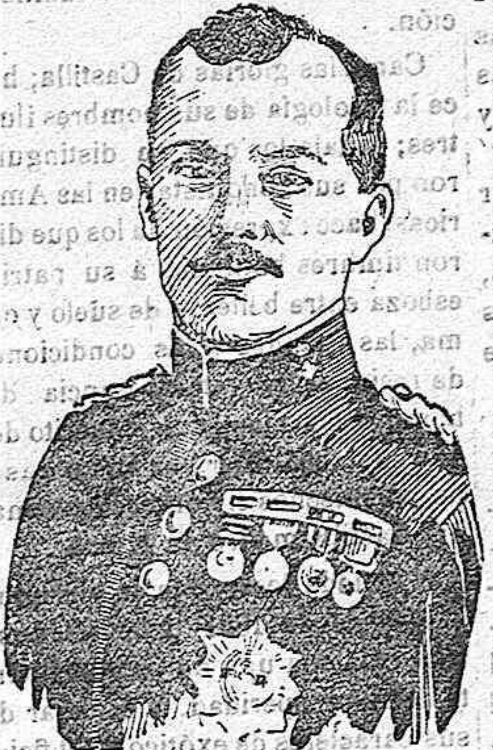
General D. Eduardo López Ochoa y Portuondo, es el general más joven del Ejército y á quien todos los jefes y oficiales de la Academia de Infantería desde 1893 organizan varios homenajes en su honor.