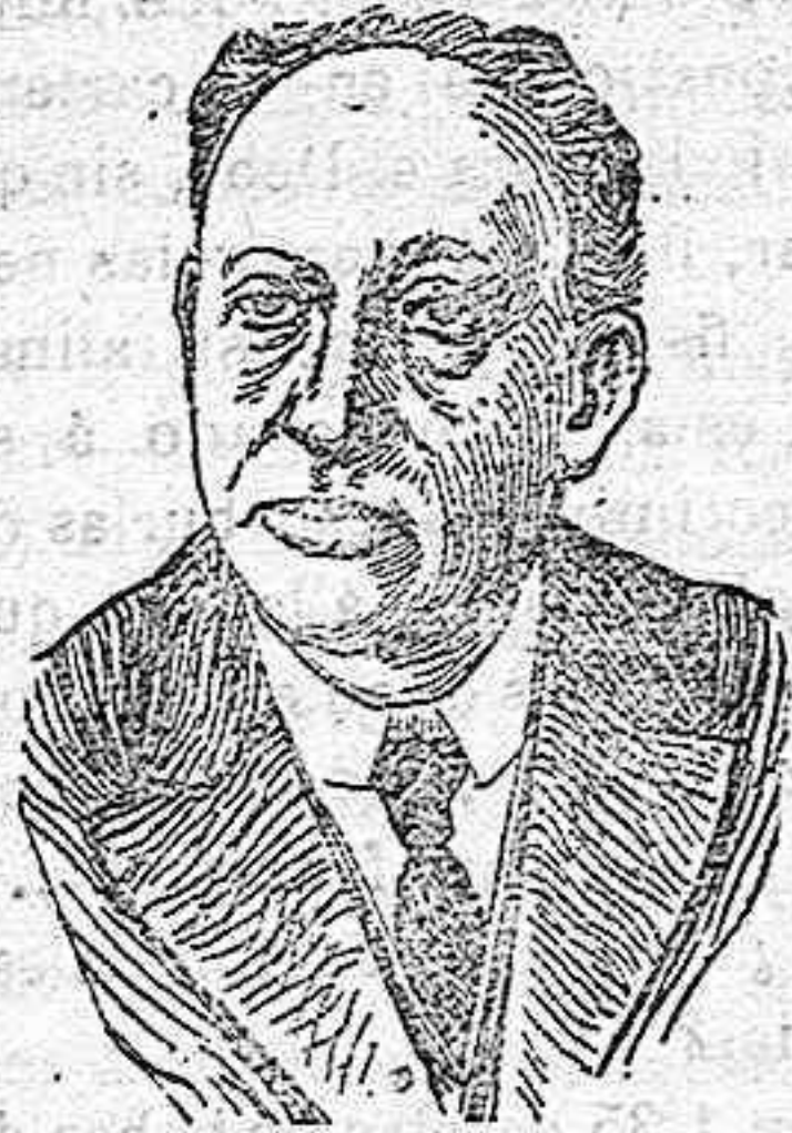
Doctor D. Maria Roso de Luna, famoso escritor científico que acaba de publicar «Páginas oculistas y cuantos macabros».