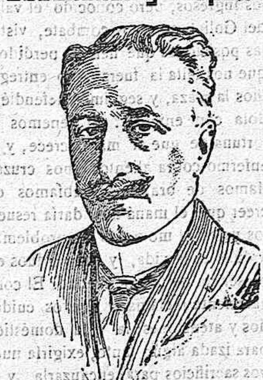
M. Paul Deschanel, que ha sido nombrado Presidente de la República francesa.

Y con conocimiento de su dignidad, esta publicación, juzga, desde un principio, necesario, al consorcio con esa verdadera representación general, parte integrante siempre de la vida de Cuerpos, y alma que preside á organizaciones con la manifestación que representa el valor de los votos y opiniones.