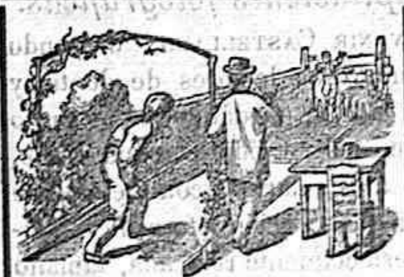
SPORT. Bolos alemanes.

En este establecimiento encontrarán la rica leche de la ganadería de Valdeavallano de Tera.