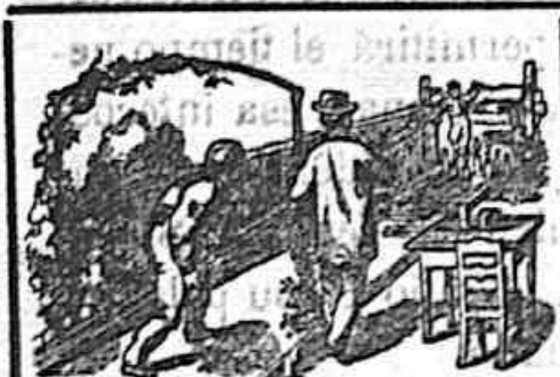
SPORT. Bolos alemanes.

URBANO CUERDA. —Plaza de Bernardo Robles (Teatinos)—Soria. Amplios salones en el primer piso con vistas a la plaza de Abastos.—Hermoso jardín para verano y cuantas comodidades requiere esta clase de establecimientos. Se sirve desde la llegada del tren correo. Visite usted esta casa y se convencerá de la bondad de sus géneros. En este establecimiento encontrarán la rica leche de la ganadería de Valdeavellano de Tera.