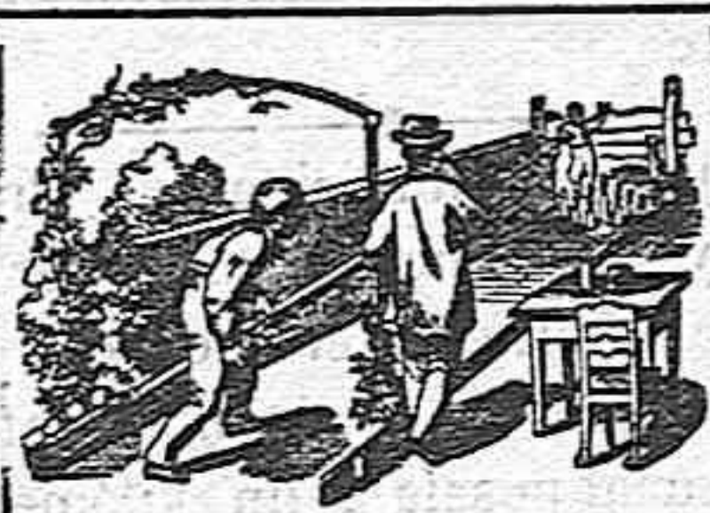
SPORT. Bolos alemanes.