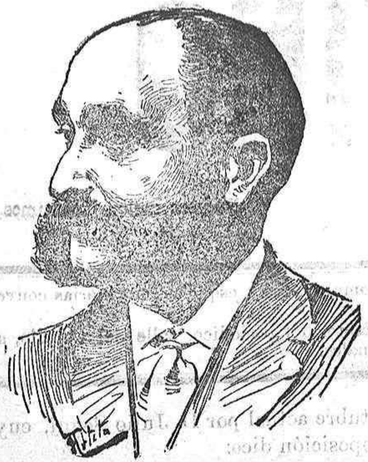
JOSÉ LOPEZ SILVA

Quien conozca las obras de López Silva, en las que se retratan de modo admirable los tipos y escenas de «la gente del bronce», y luego después a ver al autor de aquellos romances que parecen cuadros copiados en tabernas, merenderos y tugurios, con sus patillitas de boca de hacha, su sombrero cordobés terciado sobre las negras persianas , su capa de alamares y su pantalón abotinado, creará que el popular poeta se pasa la vida alternando con la gente que describe y solo duerme en su casa por casualidad. Nada más equivocado ni lejos de la realidad. López Silva ni siquiera es de los escritores que van de juerga , ni mucho menos de los que creen que se estudian tipos haciendo nocturnas excursiones y regresando a casa con la cabeza tan insegura como los pies; pues su vida es tan metódica como la del burgués que se separa de todo bullicio para cuidar más atentamente de sus intereses.