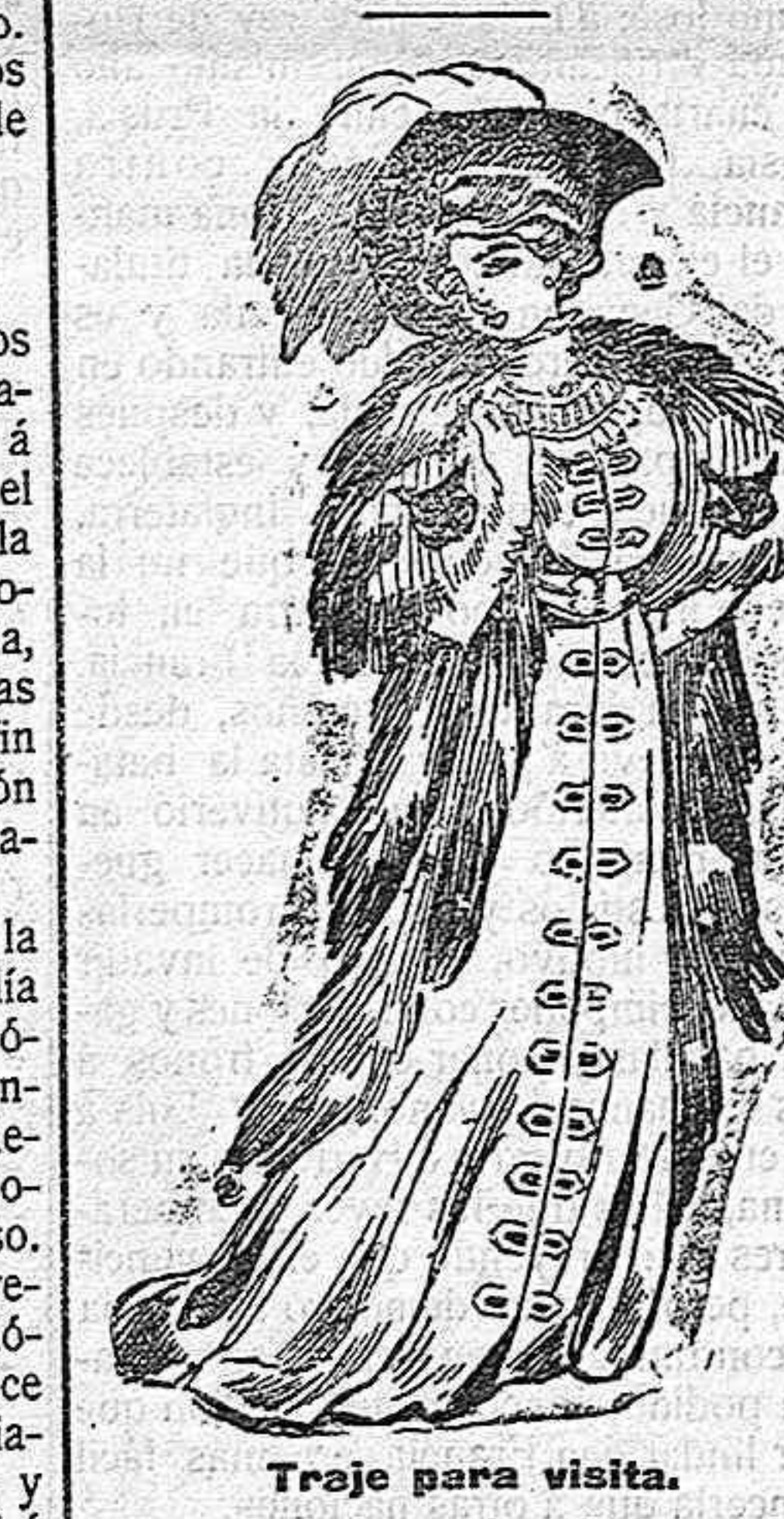
Traje para visita. De paño, color ceniza. Cuerpo y falda de una pieza, adornado con aplicaciones de seda y terciopelo en todo el delantero. Cuello con descote guarnecido con perlas. Manga corta. Cinturón de seda. Gran bot con cabezas de nutria.