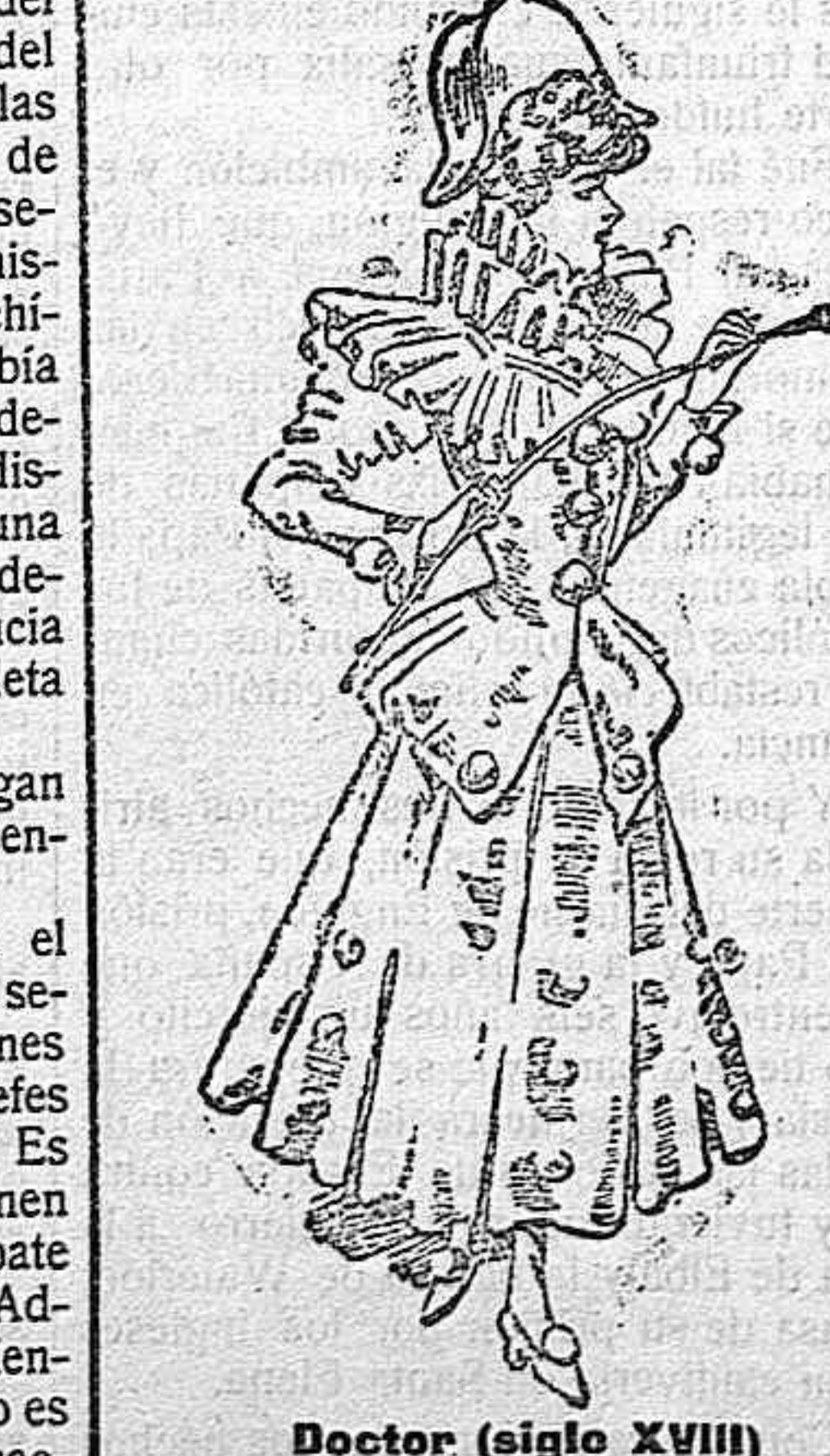
Doctor (siglo XVIII). Vestido satin blanco. Cuerpo levita ajustada, con tres grandes botones en el delantero y uno en cada extremo de la prenda. Manga estrecha y abierta en el puño, con otro botón. Triple gorgera de

encaje encajonado. Falda tableada, también con botones. Tricornio forrado de seda ó fieltro del más fino.