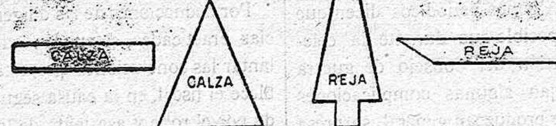
RECORTES Y PLETINAS PARA FABRICACIÓN DE HERRADURAS.