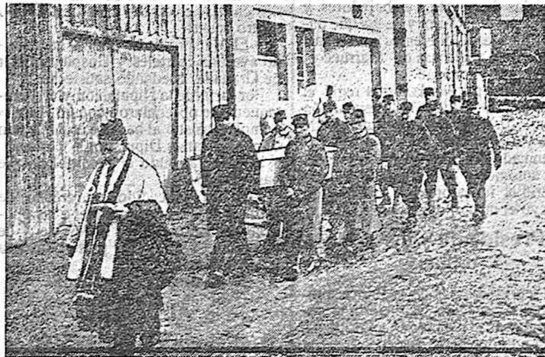
ENTIERRO DE UN MILITAR FRANCÉS MUERTO EN EL CAMPO DE BATALLA. ES CONDUCIDO POR SUS CAMARADAS Y ACOMPAÑADO DE UN SACERDOTE-SOLDADO.

viduos, unión sana y santa, ideales nobles, cultura, laboriosidad y buena voluntad.