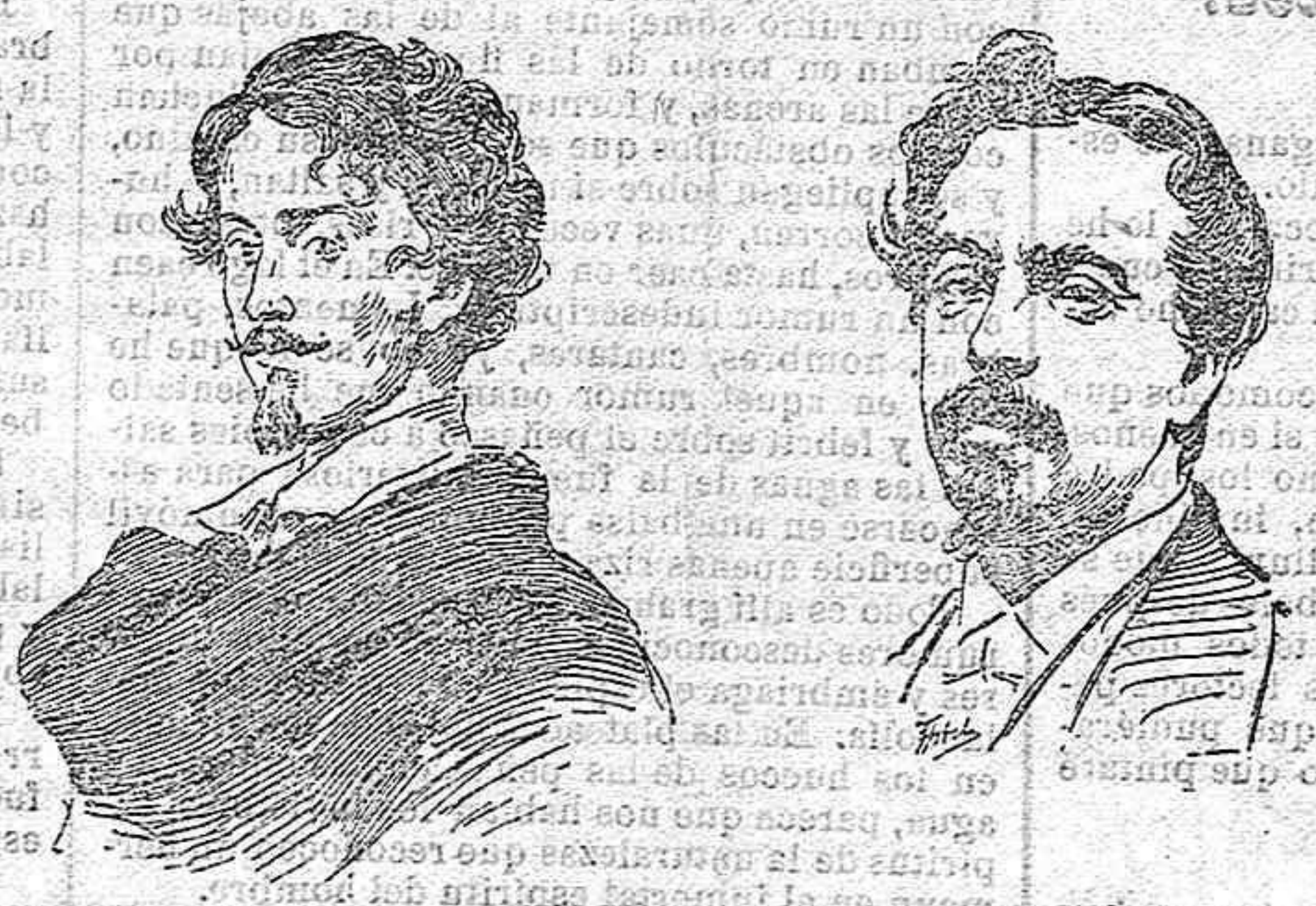
Gustavo Adolfo Bécquer.

Y paralelo á esta dolencia del cuerpo—que en otra cualquier ocasión hubiera sido menos molesta para mí—padezco también un grande, un íntimo dolor en el espíritu, cuya causa inmediata, originaria, exclusiva, única, no es otra que la imposibilidad absoluta en que me hallo de colaborar con mi pluma humilde—tan desmedida, tan favorable, tan elevadamente ponderada por la suya ilustrada y docta—en ese magnífico acontecimiento glorioso, en ese acto sublime de cultura y enseñanza y admiración sincera, venerando el estro de un escritor insigne—acaso preterido por sus paisanos de la florida Hispalis ruinosa y alegre—que