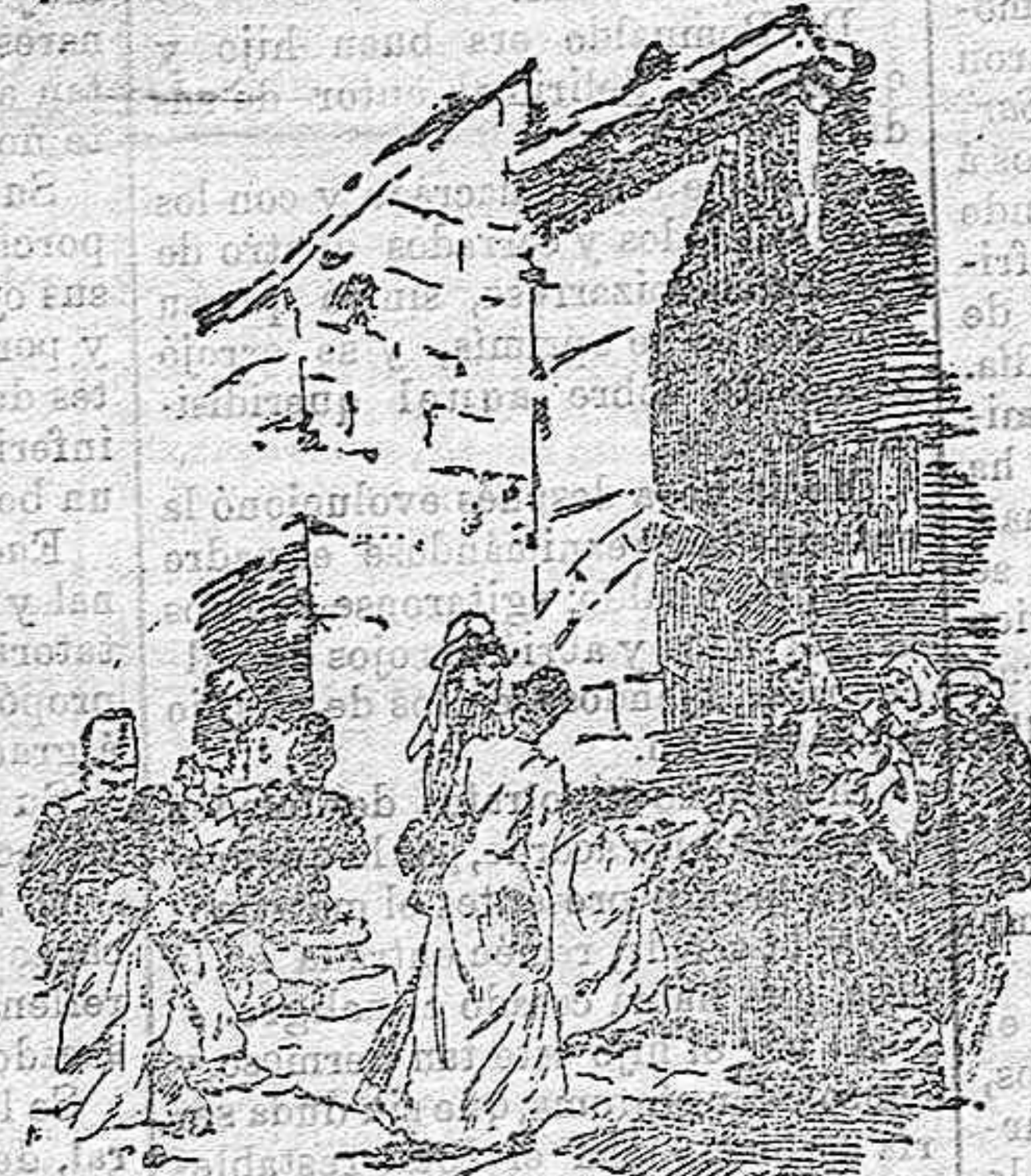
Puerta principal de la Basílica de la Natividad.

La ignorancia de los primeros ha dejado que se dé tal espectáculo en plena nave de la basílica. Ellos, en efecto, cortaron aquélla por la mitad con un muro de piedra blanca, y así un templo que permaneció casi intacto durante quince siglos y en épocas tempestuosas, ha quedado expuesto en nuestros días á estas atrocidades, merced á los monjes griegos. Se pensaría que al levantar tan odioso muro se propusieron preservar el coro ó el lugar preciso de la Natividad, pero no es así, puesto que á él se llega fácilmente franqueando tres escalones se entra en el santuario. El coro, bajo elegante cúpula, resguarda un tosco, altar griego, en el que brillan los iconos dorados.