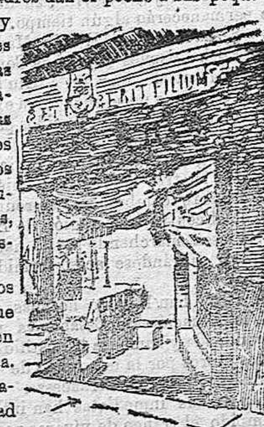
Nicho del Pesebre.

A la izquierda del coro, sobre una banqueta de madera, dos soldados turcos dan guardia medio adormilados. Junto á ellos dos gradas circulares descienden hacia una puerta. Pasada esta sigue la escalera, al final de la cual hay otros dos soldados en igual forma.