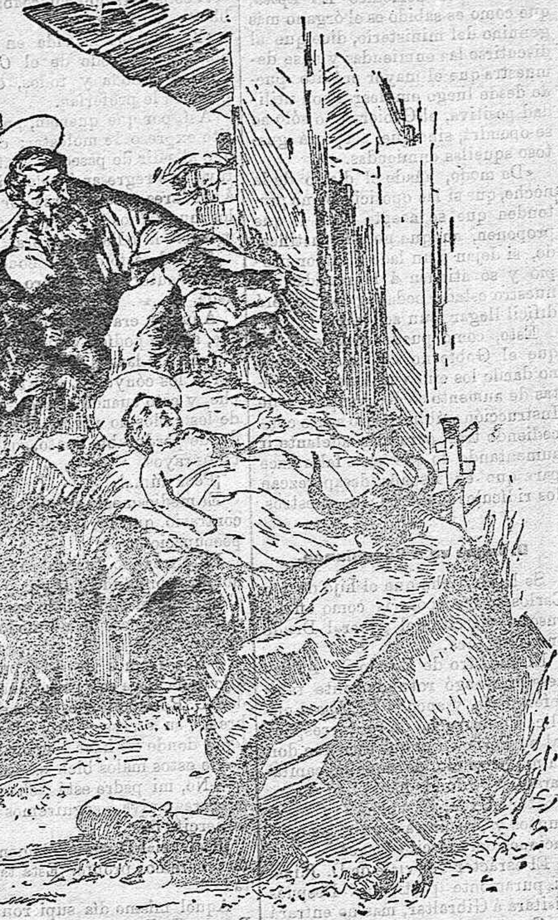
LA NATIVIDAD DEL SEÑOR

En el centro de este atrio están las cisternas bautismales en las que antiguamente hacían sus abluciones los cristianos. Próxima á la explanada se divisa un parterre con tumbas blancas, cerrando los otros dos lados de aquellas altas y desnudas murallas, que lo mismo pudieran ser de fortaleza que de convento ó prisión. Pequeñas ventanas, muy escasas, aparecen en lo alto, extrañando sobre manera no ver ninguna puerta. Sin embargo, siguiendo con la vista á algunas personas se observa que llegan al muro, se inclinan hasta casi po-