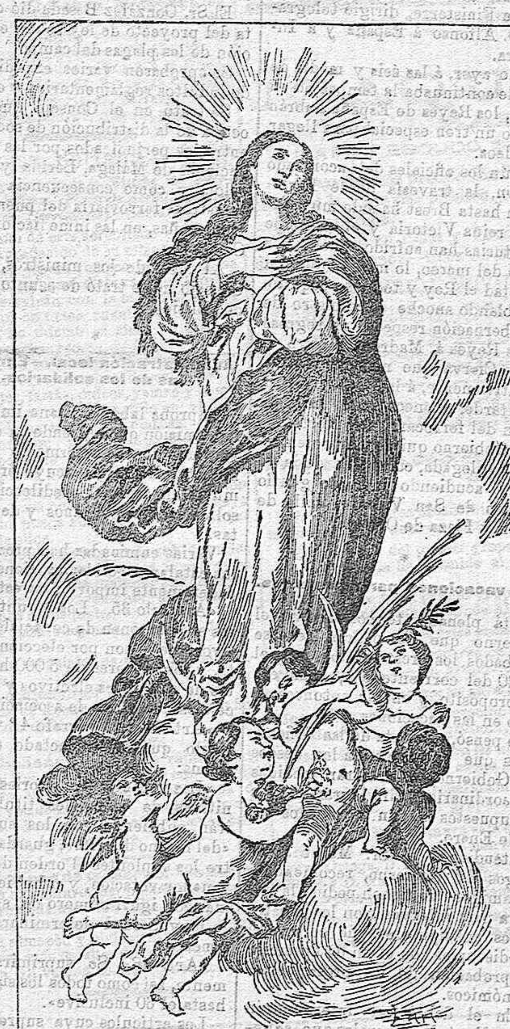
LA PATRONA DE LA INFANTERIA.