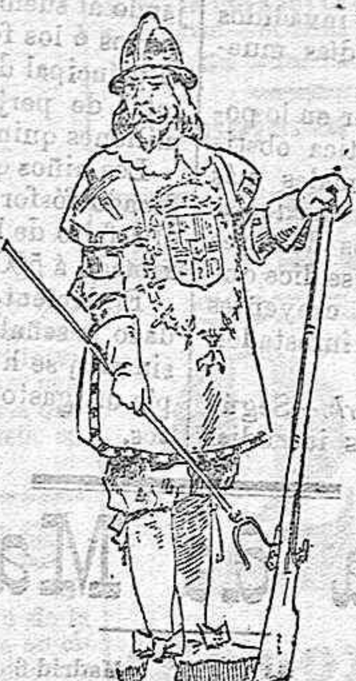
MOSQUETERO DEL SIGLO XVII.

Sus trajes lo componían el moniato , el brachial , ó bien el colobio ó levionario , cubriendo sus piernas con los anchos calzones llamados bracas , y los pies con los sockos , llevando en la cabeza una especie de mitra, que denominaban eyramiello . Las