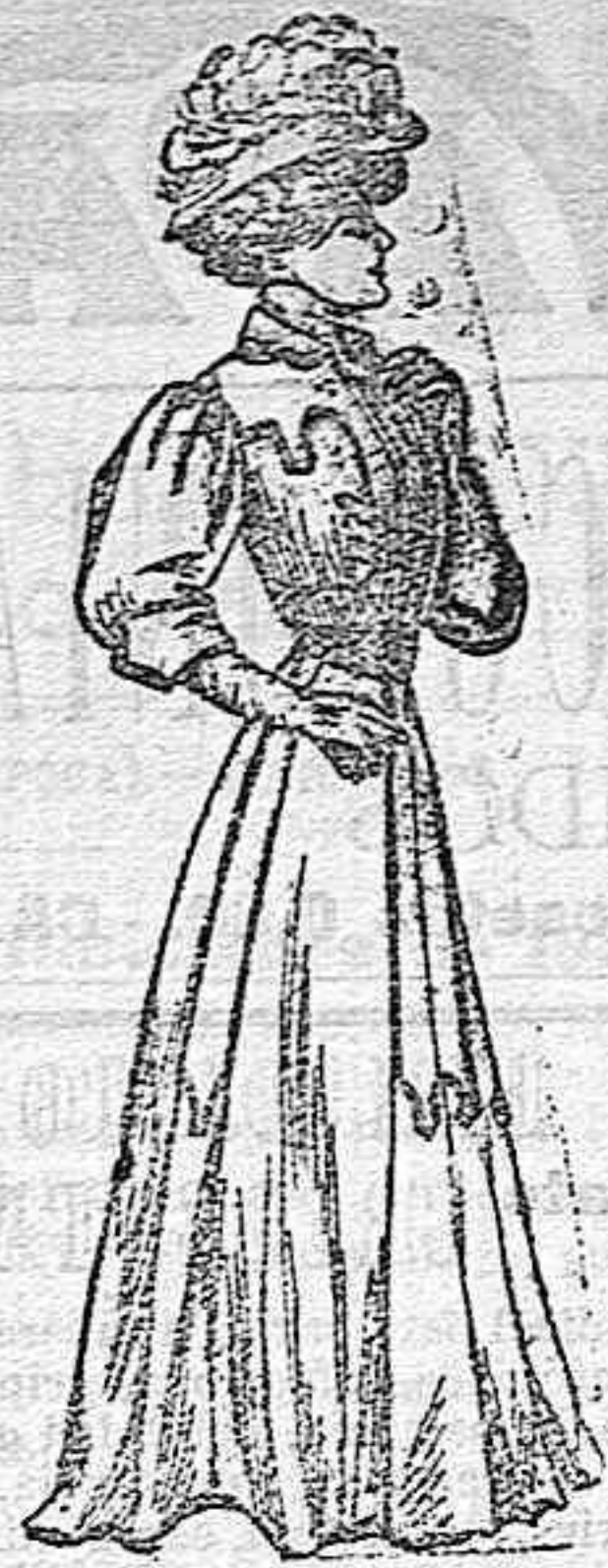
Traje para calle.

De lanilla, color crema. Bolero con adornos de pasamanería, con manga ancha y corta y puño con cartera. Cinturón de seda negra. Falda a pliegues con varias aplicaciones de pasamanería que la adornan desde la cintura hasta su mitad.