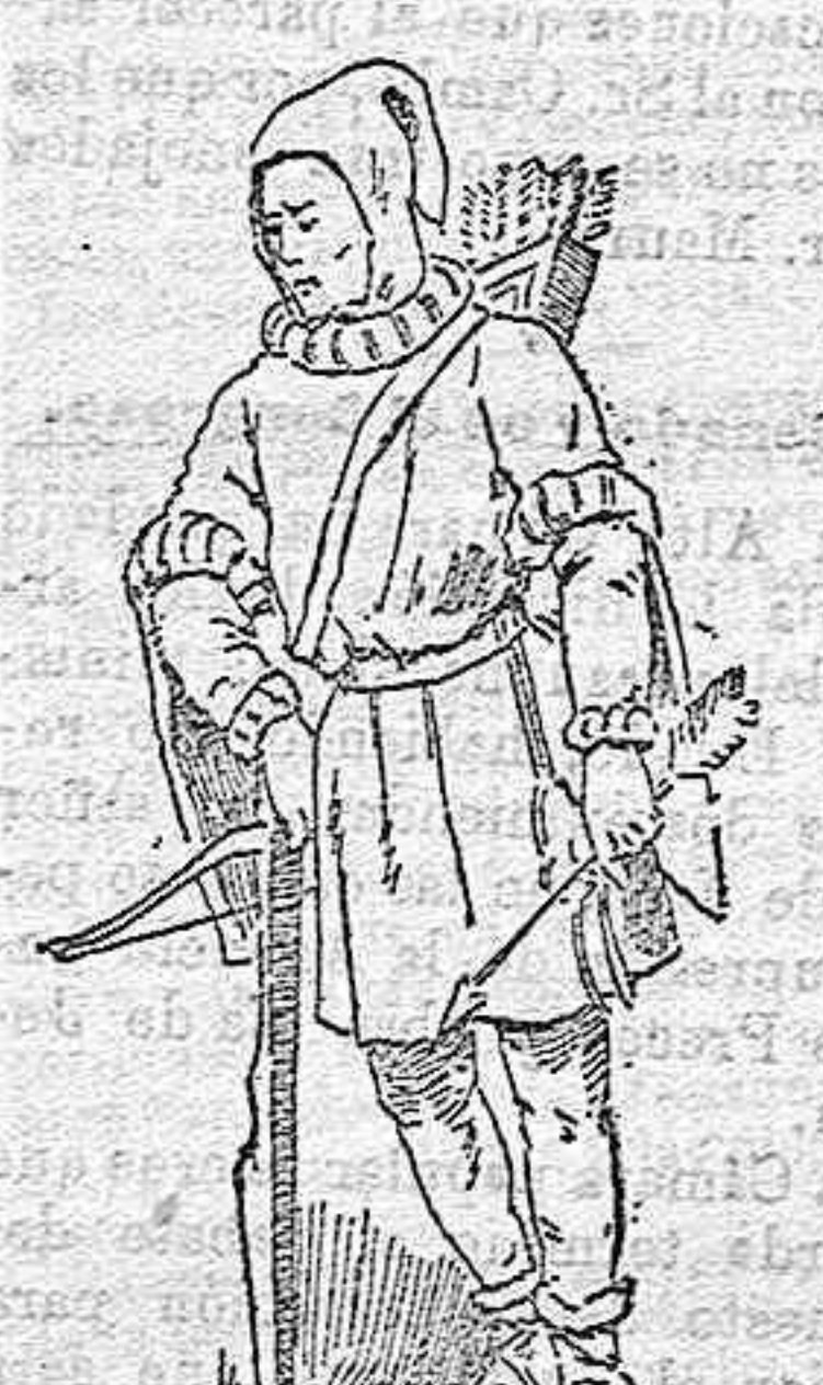
BALLESTERO DEL SIGLO XV.