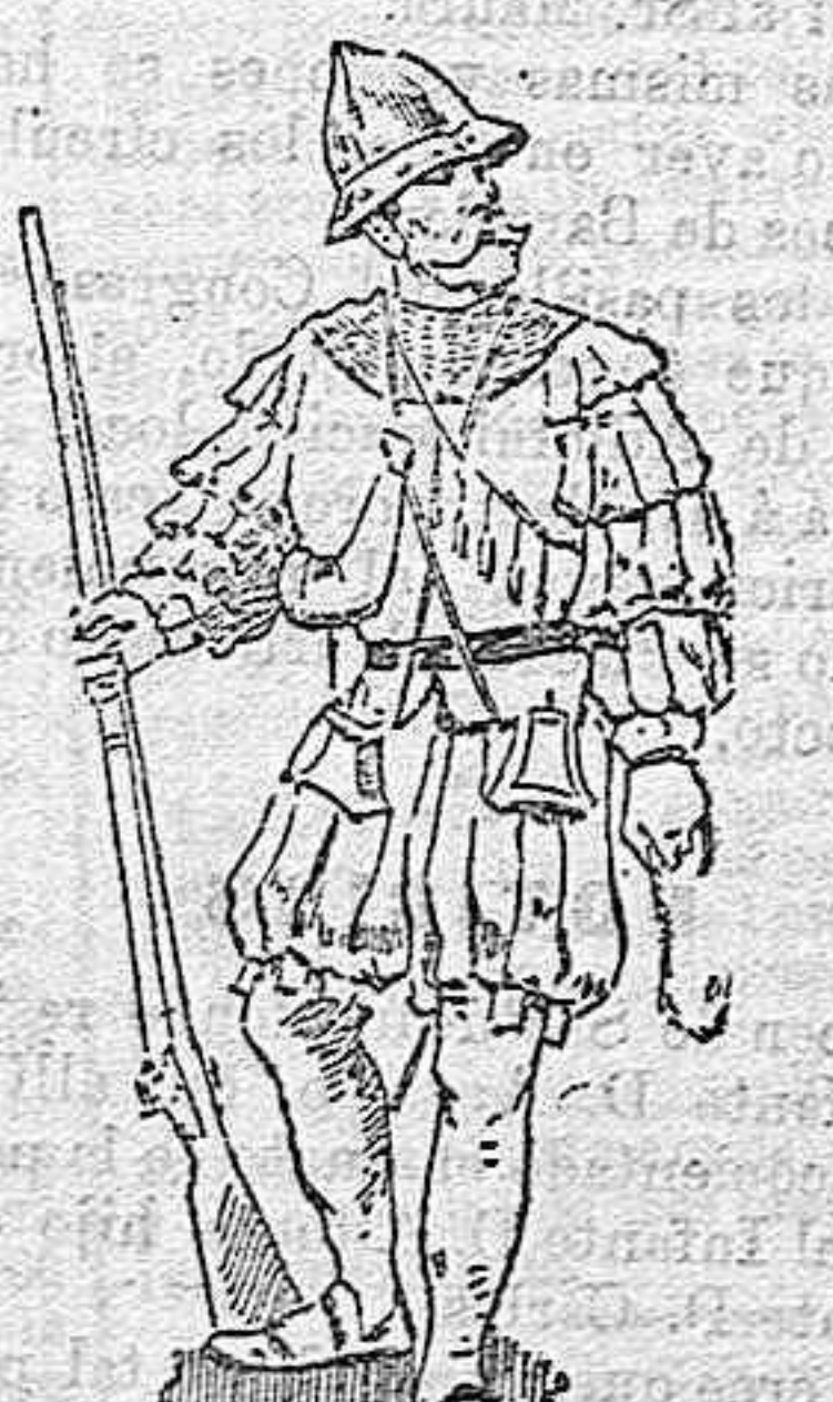
ARCABUCERO DEL SIGLO XVI.