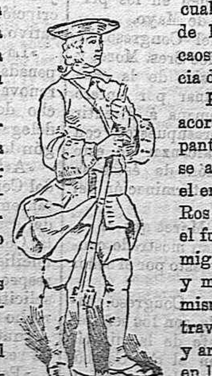
FUSILERO DEL SIGLO XVIII.

armas, eran el arco y el carax , bastón con pomo de hierro y regatón de acerada punta y el dolon (puñal).