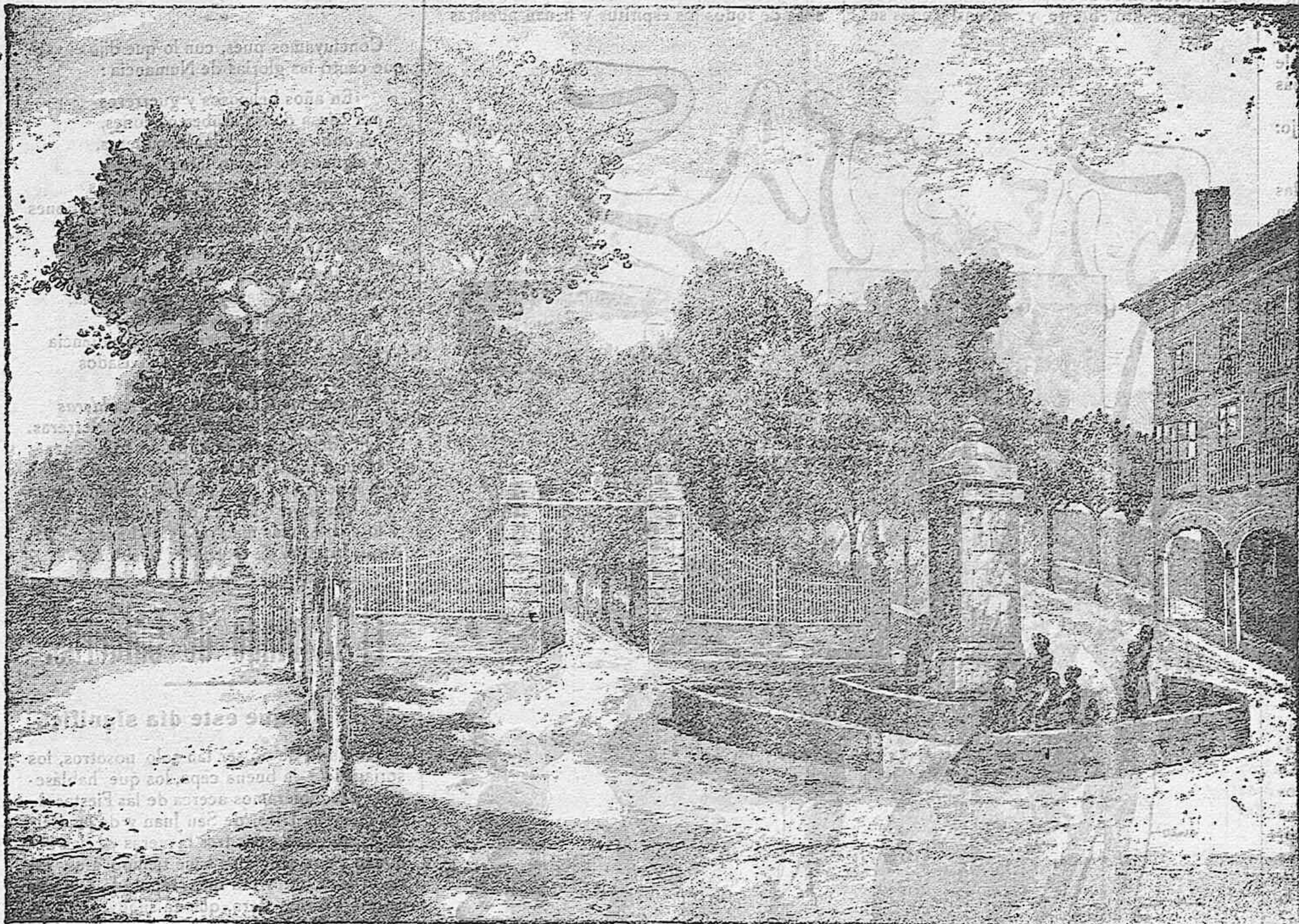
Entrada a los jardines de la antigua Dehesa de San Andrés (hoy Alameda de la Ciudad) donde se celebra la Verbena de las Fiestas.

bandera reformista, confiando en que alguna vez he de tener más suerte y he de conseguir algo, aunque no sea más que por aquello de que «pobre porfiado, saca mendrugo».