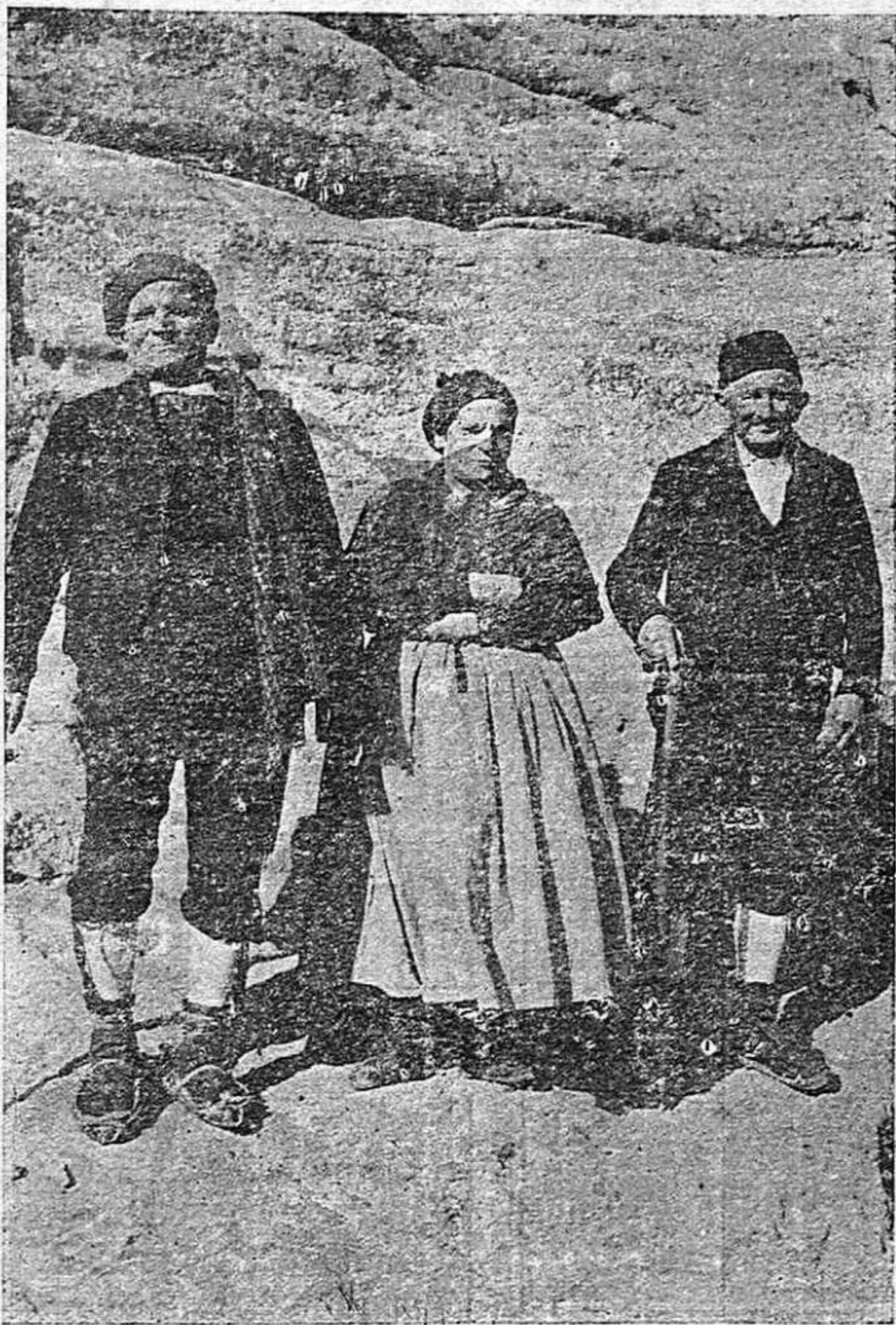
...tres sorianos que merecen nuestra veneración