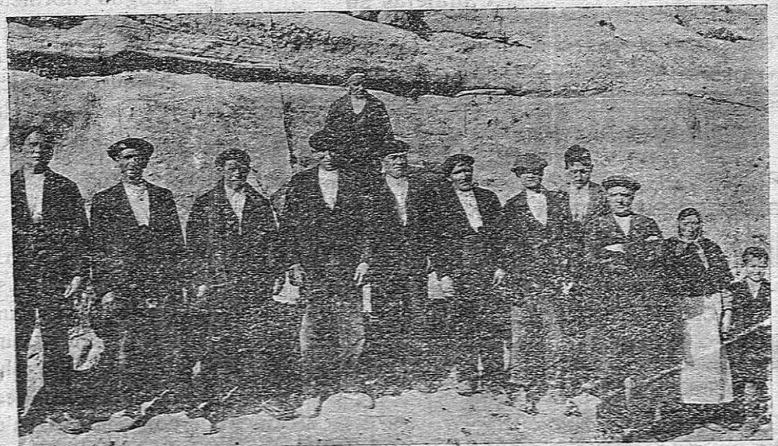
...Autoridades y funcionarios

Hogaño son gentes sobrias, sencillas, buenas, que reflejan el optimismo de la mocedad como ese