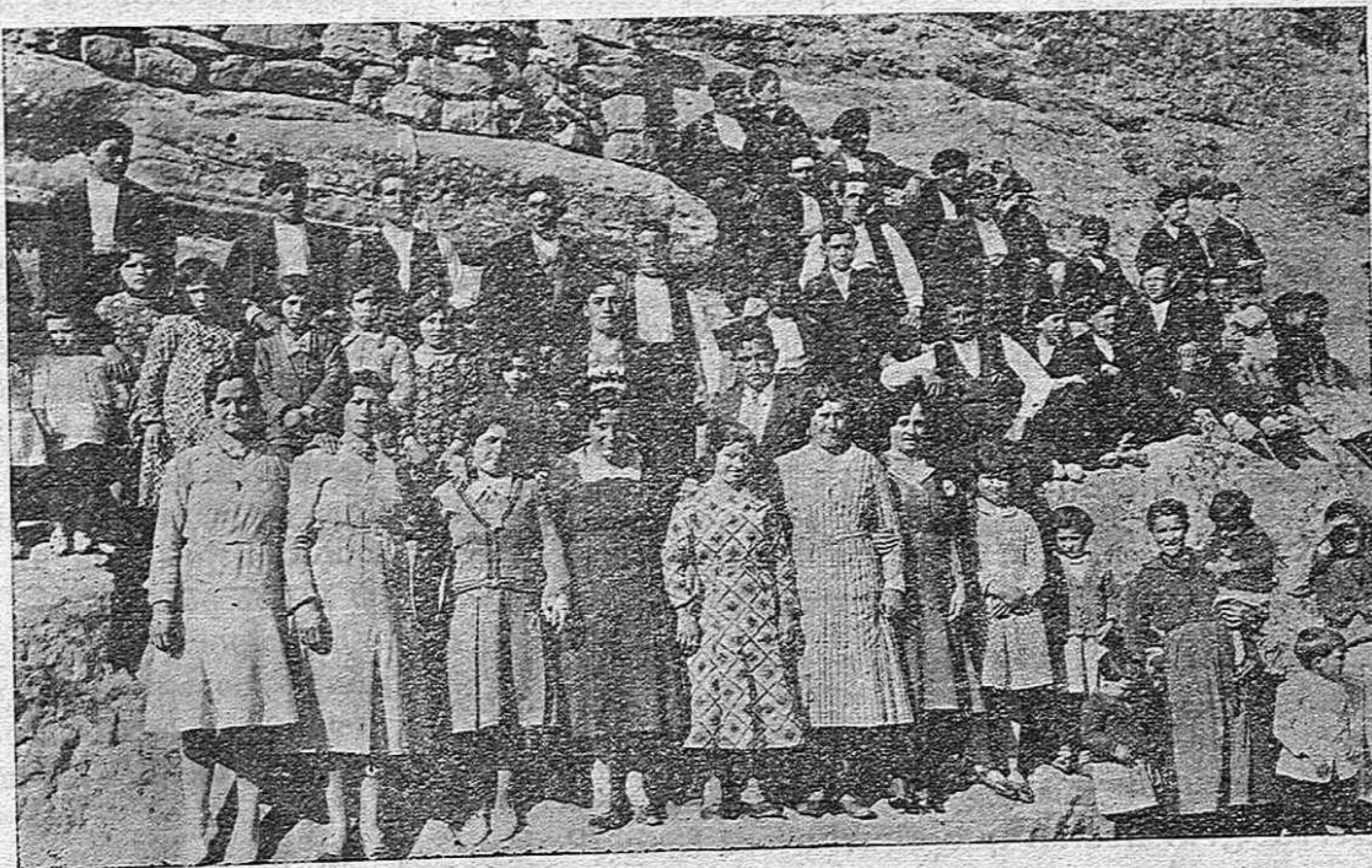
...grupo de juventud que se adelanta del fondo de peñas que da sobrenombre al pueblo.

Hemos recibido de las autoridades y del vecindario muestras de su hospitalidad y cariño y antes de despedirnos de gentes tan sencillas hemos mirado al fondo del Valle que se forma alrededor de un riachuelo y tiene hermosos y abrigados rincones. Arbolado, pradera y huertos, forman los jardines de Alcubilla. El río «Torote» cuyo nombre toma en Miño, cruza el término para convertirse en Caltojar en el Río Escalote y acercarse por tierras de Berlanga a confundir sus aguas con las del Duero.