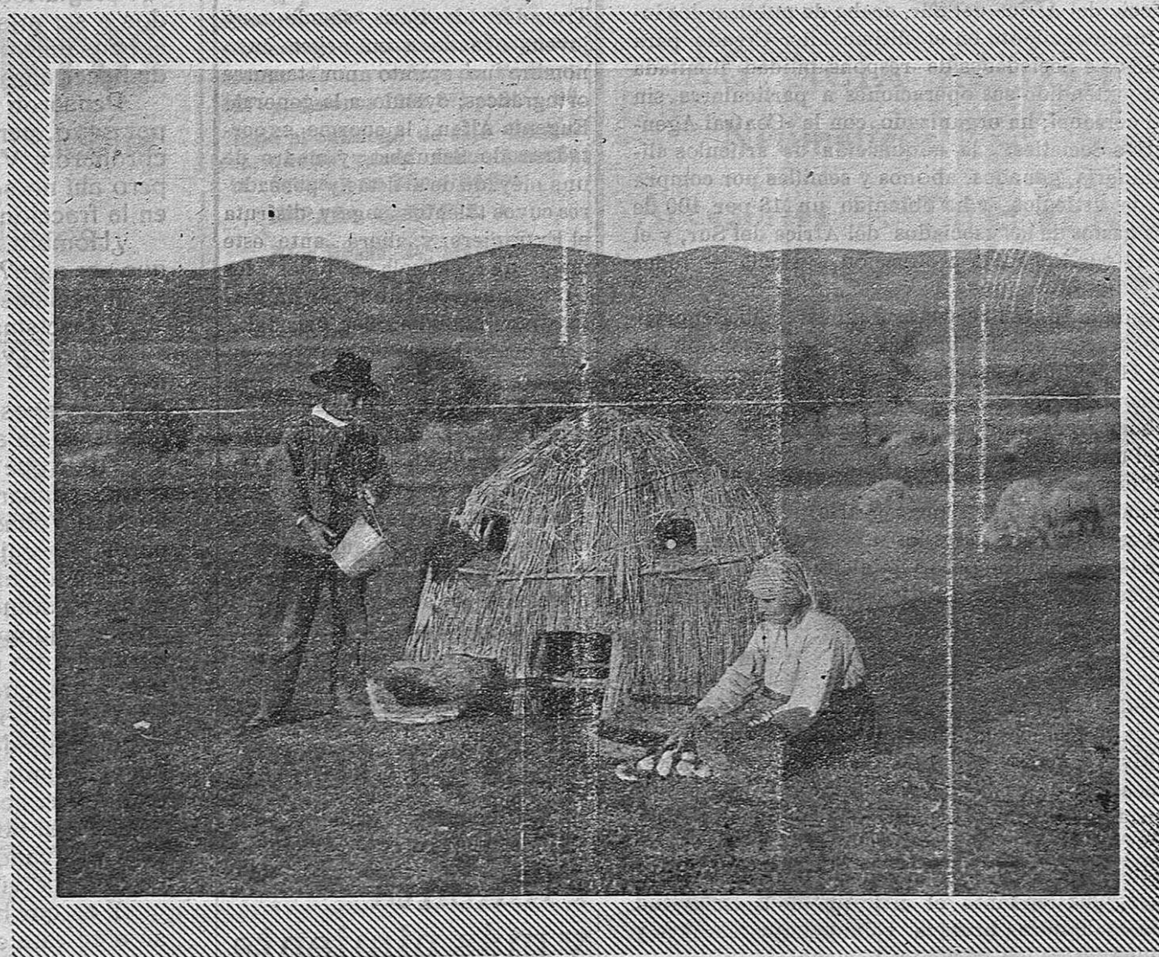
En el renombrado valle ganadero de Alcuía está hecha la presente foto, que recoge una bella escena pastoril. He aquí un matrimonio que busca en la cría del ganado el medio de vida para satisfacer sus modestas necesidades, y les permita una tranquilidad que difícilmente encuentran los obreros de la ciudad.

Del clamor de aquella asamblea «in desertum eternum», en que minifundistas castellanos, como los verdaderos agrarios de las demás regiones, no sacaron otra consecuencia que el continuar en la obra paciente de trazar con la reja y la esteva sobre el surco, la protesta sorda ante el estrujamiento de que les hacía objeto el parasitismo, y los truts de importadores del litoral, hubieron de aprovecharse los que desconociendo la dureza del cierzo en el páramo e incapaces de estar tres horas cara al sol en una barcaína extremeña, tomaron como autoridad indiscutible el programa político elaborado en la ciudad para reformar el agro en orden inverso a la economía nacional y los desvelos del que en el campo tiene empleados capi-