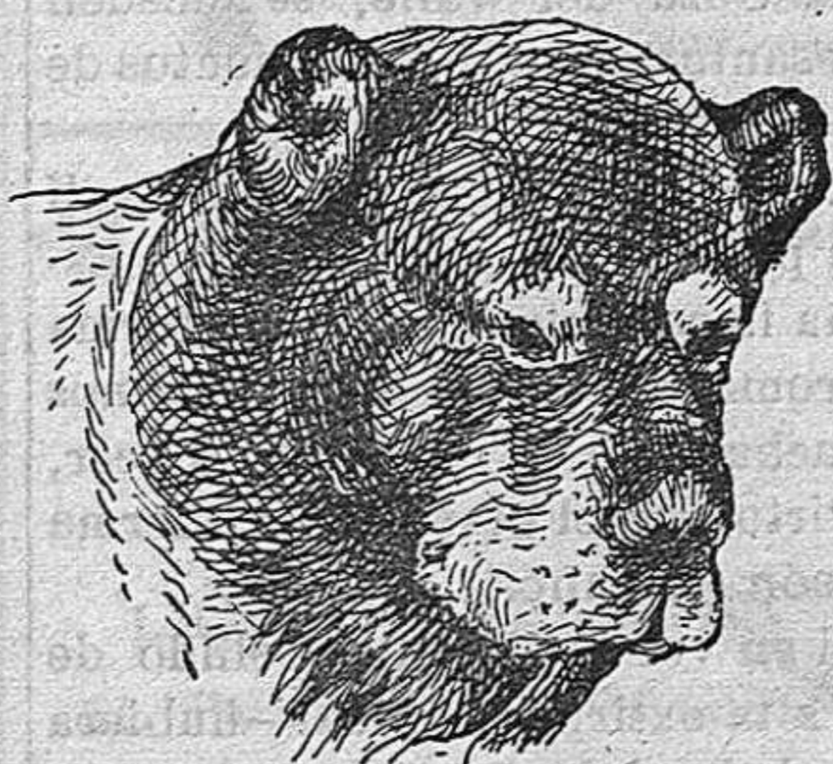
Perro mastín español