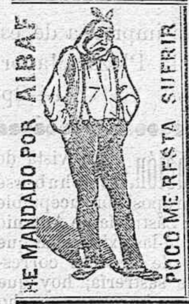
HE MANDADO POR AIBAE POCO ME RESTA SUFRIR

por ser el remedio más poderoso é inocente que se conoce hoy para producir este cambio tan rápido y positivo. Destruye también la fetidez que la carie comunica al aliento. De venta en todas las buenas farmacias de esta provincia. — En Soria Farmacia del Sr. Monge, Postigo 10, á 2 pesetas bote.