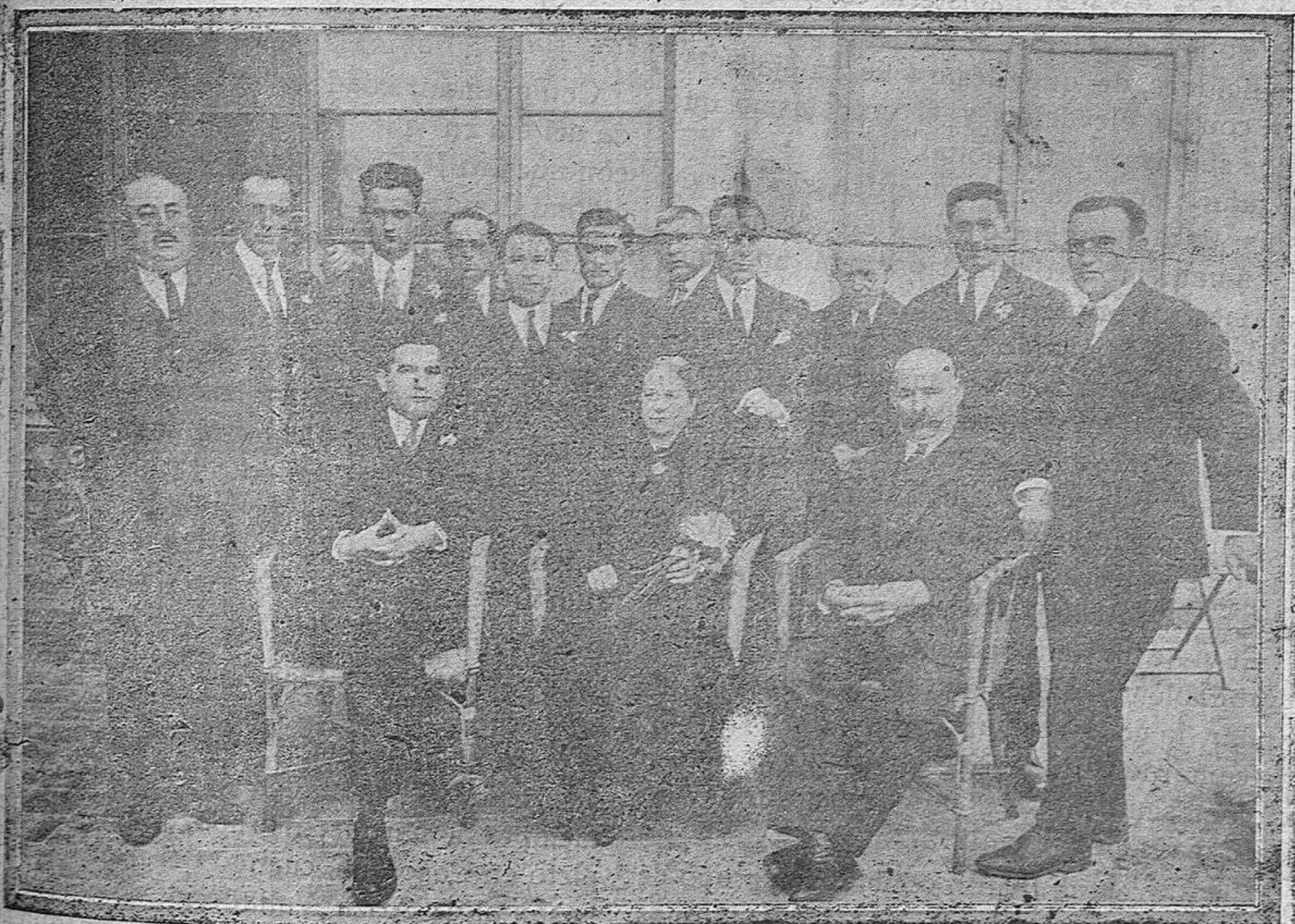
EL GRUPO DE MAESTROS DE SORIA, QUE DIRIGIDOS POR