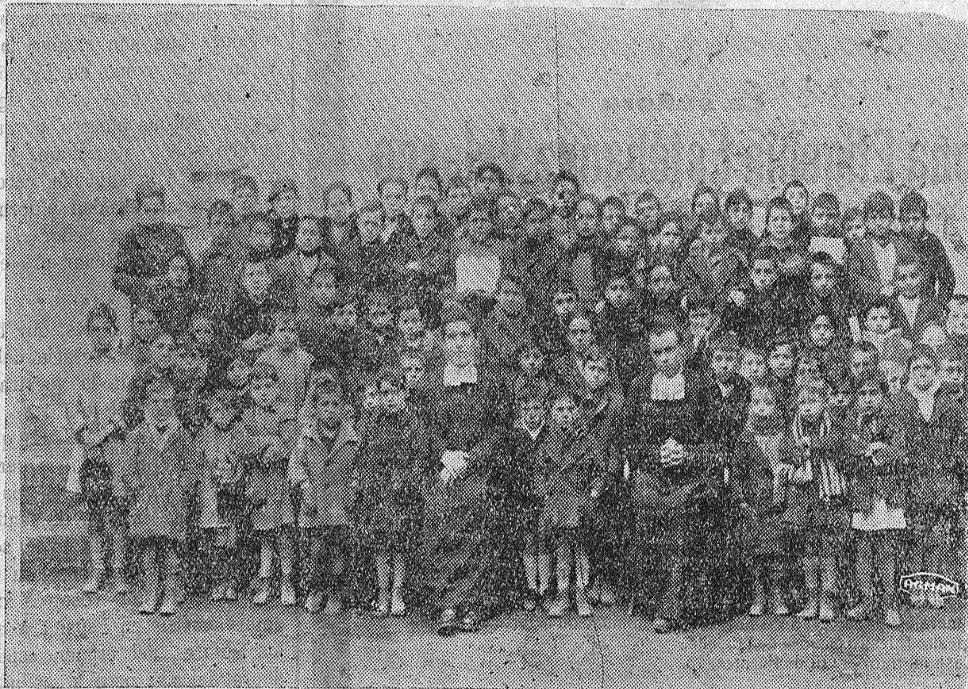
Un puñado de niños cuya educación escolar corre a cargo de dos hermanos de San Juan Bautista de «La Salle»

Consulte precios a Ramón Miguel-Electricidad-Mayor Pral., 107, Palencia. Personal técnico con título oficial.