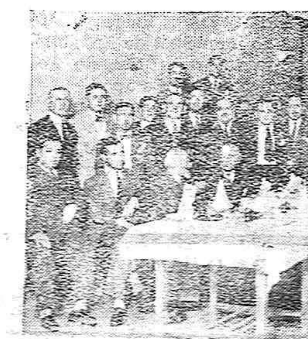
CASA DE PALENCIA EN MADRID.—Para festejar el día del Patrón de Palencia, se reunieron en este Centro un grupo de entusiastas, almorzando en fraternal camaradería.

Cuide usted su estómago porque es la base de su salud * Yo padeci también como usted, pero me curó el DIGESTÓNICO del Dr. Vicente VENTA EN FARMACIAS