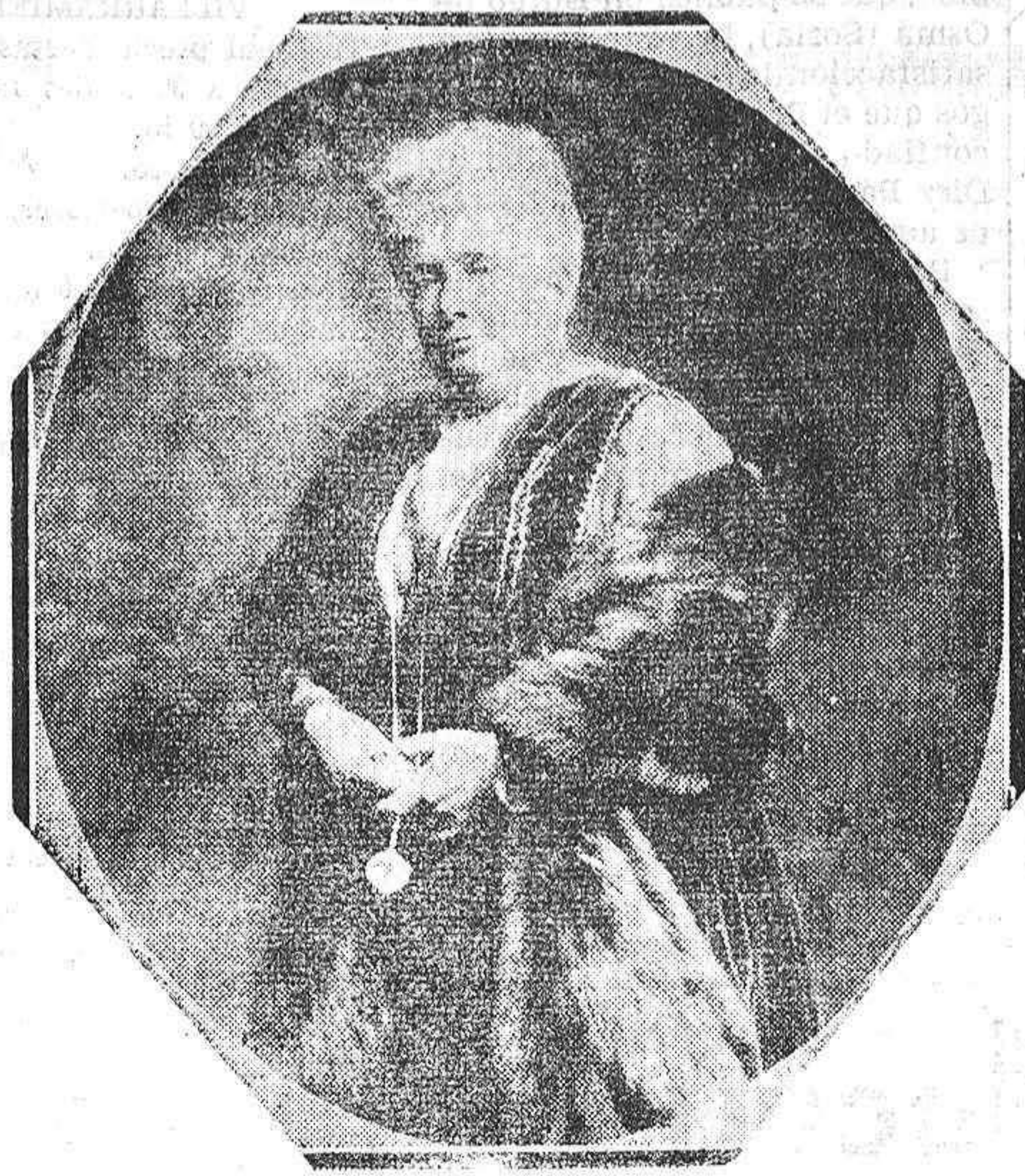
La Infanta de España, doña Isabel de Borbón, cuyo fallecimiento, en su última residencia de París, ha venido a añadir una fecha histórica más a la época culminante que atravesamos los españoles.

EL DINERO IMPUESTO EN LOS SINDICATOS HA SERVIDO PARA REPOBLAR EL VIÑEDO Y RESOLVER EL PROBLEMA SOCIAL DE LA TIERRA EN MUCHOS PUEBLOS